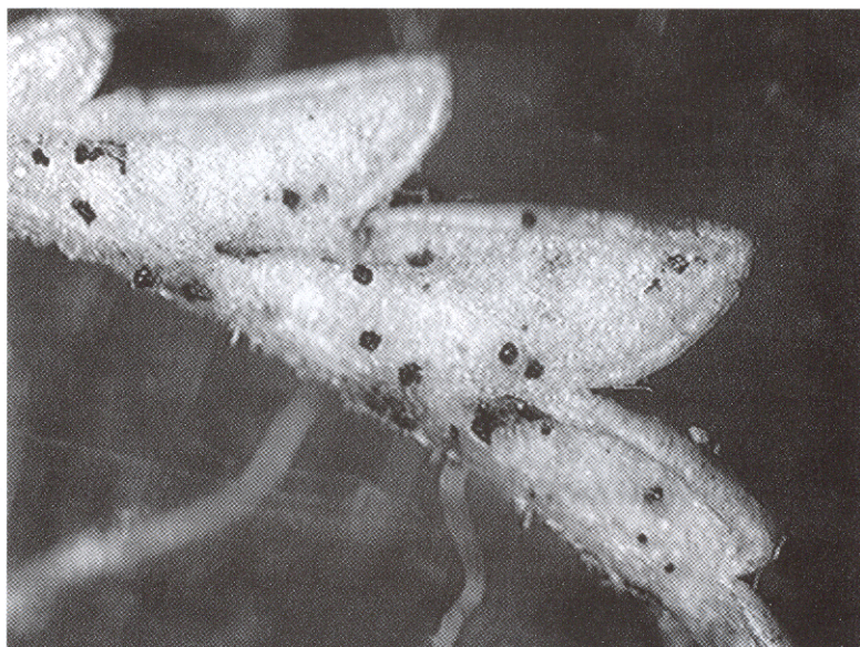
Fig. 2. Envés de una hoja de damiana con huevecillos de Corythaica carinata Uhler.

15 de noviembre en adelante, después de haberse caído las hojas, las plantas iniciaron el desarrollo de retoños. De un total de 318 plantas de damiana, 17 fueron afectadas por esta especie, localizándolas en una área bien definida dentro de la parcela. Se deduce que estos tñgidos se dispersaron de una planta a otra, cuando la temperatura media ambiental fue alta ( 25.1-28.4° C), disminuyendo su población a temperaturas de 19.2-21.7° C, hasta desaparecer completamente, para dar paso al brote de nuevas hojas, recuperándose las plantas en un 100% (Cuadro 1). Con estos resultados, proporcionamos una nueva localidad en México y un nuevo hospedero para C. carinata , no descartando la posibilidad de que haya sido transportada por alguna especie de Solanaceae introducida y que esté en vías de adaptarse como plaga potencial a otras especies nativas silvestres y cultivadas del estado.