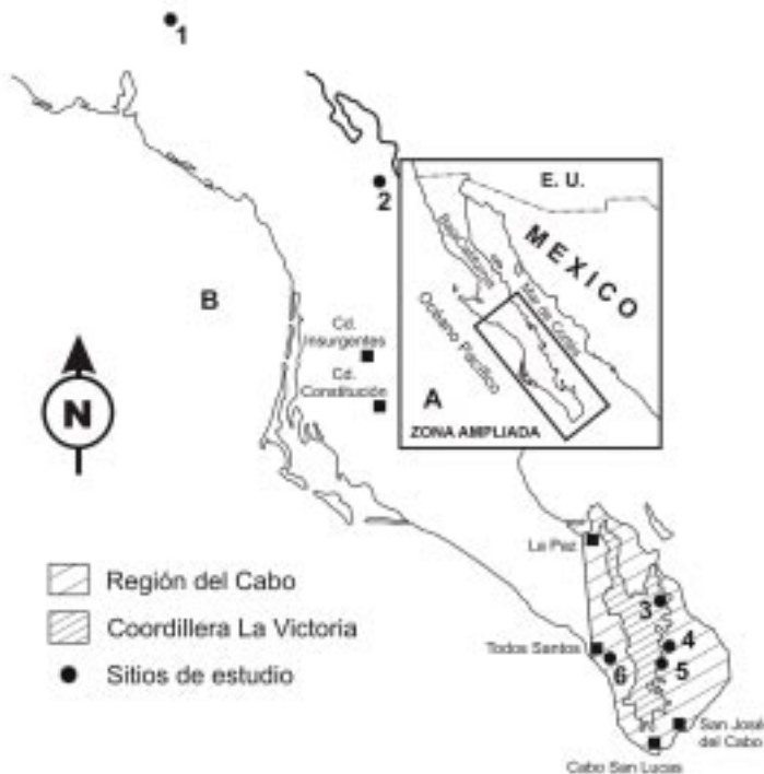
Fig. 1. La península de Baja California es en general desértica. Su extremo sur, con mayores precipitaciones, es de características árido-tropicales, y concentra varios humedales que han generado asentamientos humanos; otros de estos ambientes en el centro de la península, se ubican de manera dispersa. 1. Oasis San Ignacio, 2. Arroyo intermitente San Juan Bautista, 3. Arroyo San Bartolo, 4. Ciénega de Santiago, 5. Pozas de Boca de la Sierra y 6. Laguna San Pedrito.

Los demás humedales se ubican en la cordillera La Victoria, a unos 230 m de altitud promedio, excepto la laguna de agua dulce San Pedrito que se encuentra a nivel del mar en la costa del Pacífico. Santiago es un poblado en una depresión de las montañas, donde un manantial forma una ciénega de aproximadamente 0.7 km 2 , sobre la cual y más allá de ella, se desarrolla una lujuriente vegetación en unos 2.5 km 2 que rodea al poblado. Abundan las espadañas y los carrizos, palmeras de taco, y arbustos como las mimosas ( Mimosa xantii ), cacachila ( Karwinskia humboldtiana ), palo de arco ( Tecoma stans ), chicura ( Ambrosia ambrosioides ), cítricos y muchos otros frutales, maizales y rodales de caña de azúcar, entre otras plantas cultivadas. Un denso matorral xerófilo rodea este ambiente, con arbustos dominantes como el palo Adán ( Fouquieria diguetii ), lomboy ( Jatropha cinerea ), palo