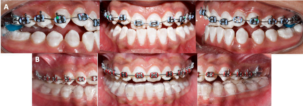
Figura 2. Alineación y nivelación. A. Inicio de tratamiento; alineación y nivelación de dientes maxilares con arco 0.014" NiTi, con uso de topes de mordida para liberar los dientes anteriores. B. placa de acetato rígido calibre 60 con un agregado de acrílico para corregir la mordida cruzada anterior, se eliminaron los topes de mordida.

Posteriormente, se siguió una secuencia de arcos 0.016" x 0.022" NiTi en el arco dental mandibular y 0.017" x 0.025" acero inoxidable (ss) en el arco dental maxilar, la cadena de molar a molar se cambió 3 veces, una vez por mes para cerrar espacios (Figura 3).