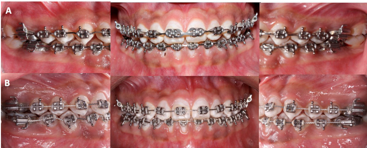
Figura 3. Progreso del tratamiento. A. Arco 0.017" x 0.025" ss superior, cadena de molar a molar. B. Arco 0.017" x 0.25" ss y ligadura metálica de molar a molar para estabilizar después de haber cerrado los espacios interproximales y cadena de central superior izquierdo a central superior derecho para cerrar diastema.

Logrados los cierres de espacios se colocó la ligadura metálica 0.010" para evitar que se abrieran nuevamente, se tomó una ortopantomografía con la finalidad de ver raíces paralelas, se recolocaron los brackets de los dientes 12, 22, 45, 44 y 43 y se utilizaron arcos trenzados de 8 hilos ( braided ) 0.017" x 0.025" superior e inferior (Figura 3. B). Para detallar el caso se colocaron arcos 0.017" x 0.025" ss superior e inferior y elásticos intermaxilares vector clase III 3/16" 4.5 oz. Se finalizó con arcos trenzados de 8 hilos 0.017" x 0.025" y se continuó con elásticos de asentamiento de 1/4" 4.5 oz. Finalmente, se retiró aparatología de ortodoncia. La retención fue con una placa circunferencial maxilar y en la mandíbula retención lingual fija.