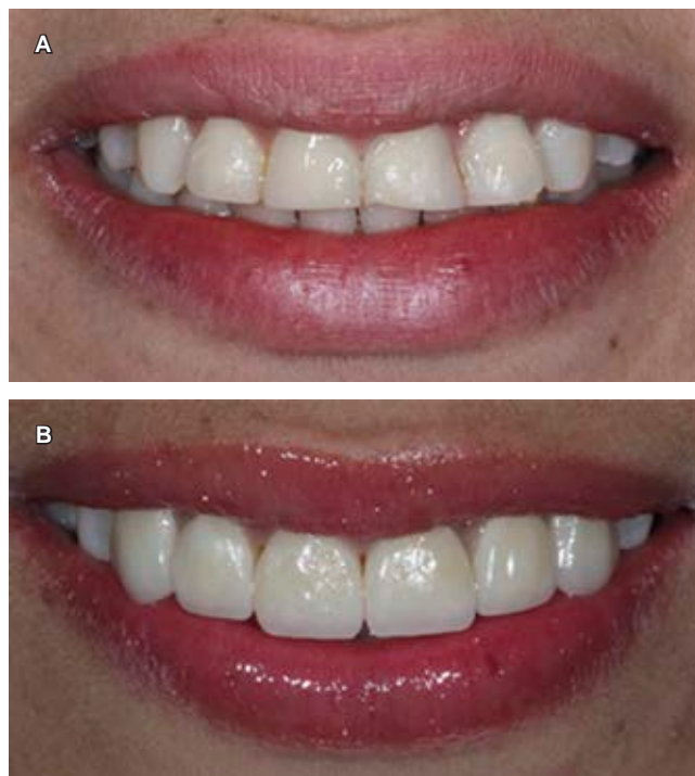
Figura 4: Análisis comparativo. A) Al inicio del tratamiento. B) Al final del tratamiento.

A) Laboratory disilicate veneers. B) Previously cemented veneers.