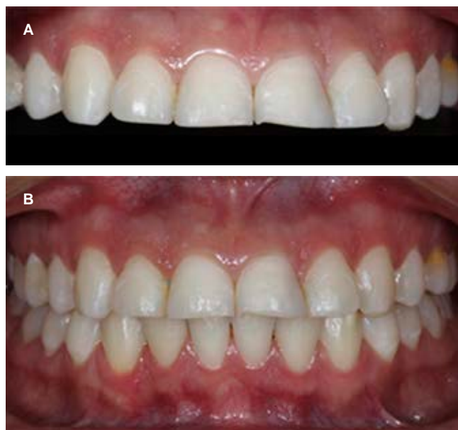
Figura 1: A) Alteración de forma. B) Oclusión. A) alteration of shape. B) Occlusion.

Se procedió a la toma de impresiones para realizar el encerado diagnóstico, el mismo que sirvió para corregir la forma y el tamaño de los dientes, continuando con el proceso se registró en una impresión con silicona de laboratorio (Zetalabor de Zhermack®). Una vez obtenido el negativo se colocó una resina bis-acryl (Structure de Voco®), posterior-