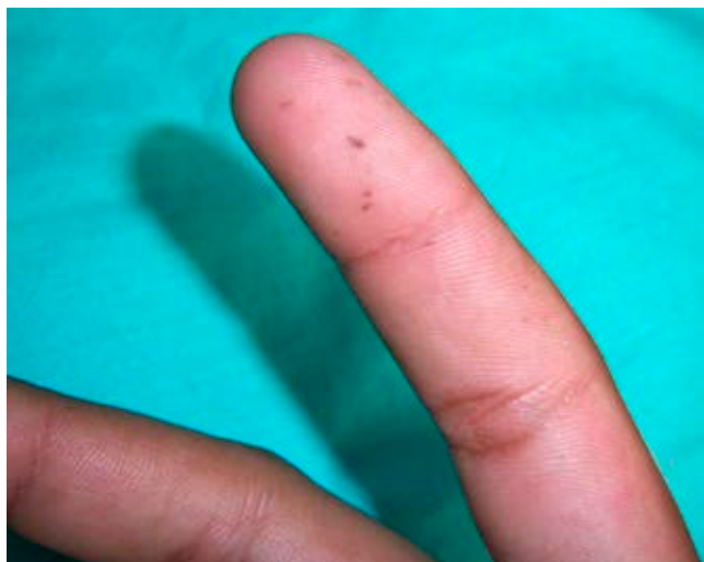
Figura 4: El paciente sólo presentaba máculas aisladas y poco visibles en la piel del dedo índice de la mano derecha.

Si bien el SPJ se asocia, como ya se mencionó, con hipermelanosis mucocutánea y poliposis gastrointestinal, también se han reportado pólipos nasales , quistes ováricos , tumores de Brenner , disgerminomas , tumores de células de Sertoli , cáncer de mama y adenocarcinomas pancreáticos . En 1895 la Sociedad Científica de Londres presentó el caso de dos hermanas gemelas con SPJ, reportando el fallecimiento de ambas a causa de obstrucción intestinal y cáncer de mama respectivamente, 4 lo cual evidencia que la interrelación del SPJ con otros subtipos de padecimientos