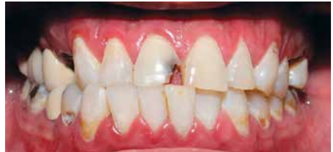
Figura 1: Vista frontal. Se observan múltiples lesiones cervicales erosivas, así como en superficies lisas (fotografía directa).

Paciente masculino de 27 años de edad que se presenta a consulta preocupado por su apariencia bucodental. Al interrogatorio refiere antecedentes de consumo de drogas, en específico metanfetaminas (cristal) durante los últimos cuatro años de manera inhalada y fumada, señalando su uso diario en este periodo, así como fumar 12 cigarrillos a la semana. Un hábito adicional referido fue la ingesta abundante y diaria de bebidas carbonatadas y azucaradas,