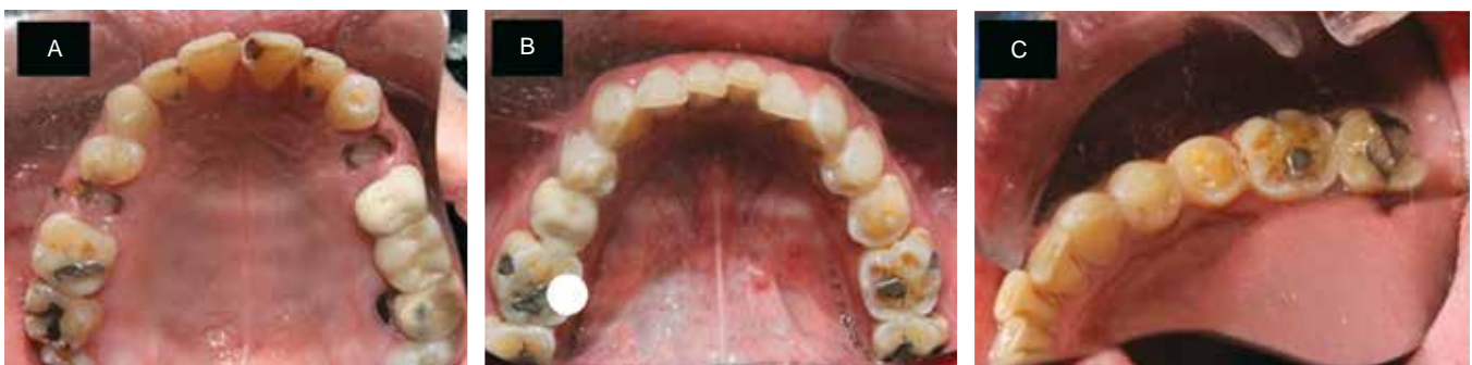
Figura 2: Vistas oclusales. A) Arcada superior con múltiples caries extensas. B) Arcada inferior, patrones de atrición atribuidos al bruxismo por metanfetaminas. C) Atrición en dientes posteriores y fosetas de desgaste oclusal.

Frontal view. Multiple cervical erosive lesions and smooth surface lesions are observed. (Direct photograph).