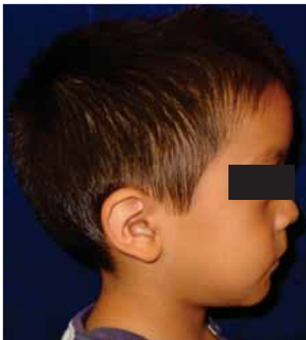
Figura 2. Abombamiento del hueso frontal por sinóstitis de sutura sagital.