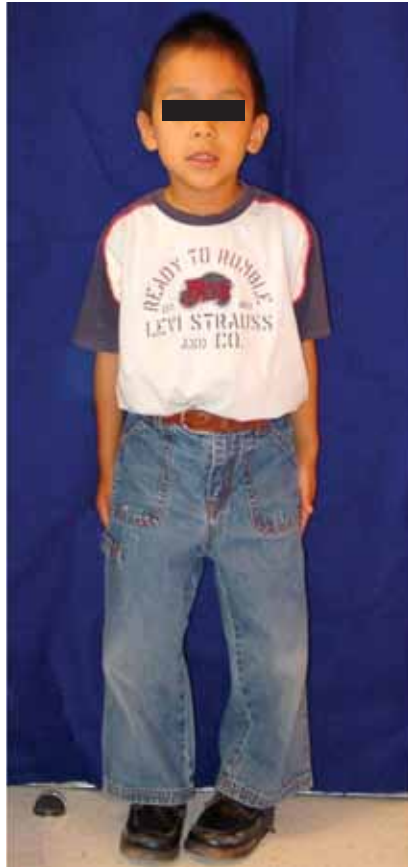
Figura 1. Arqueamiento de extremidades inferiores.

Tomando en cuenta el diagnóstico de base del paciente y encontrando los hallazgos clínicos reportados