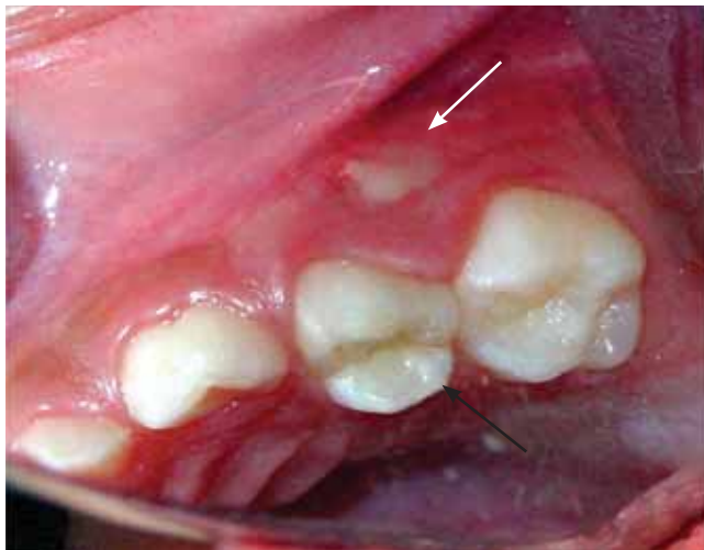
Figura 6. Lateral izquierda. Fístula a nivel de diente 64 (flecha blanca) y ausencia de caries (flecha negra).