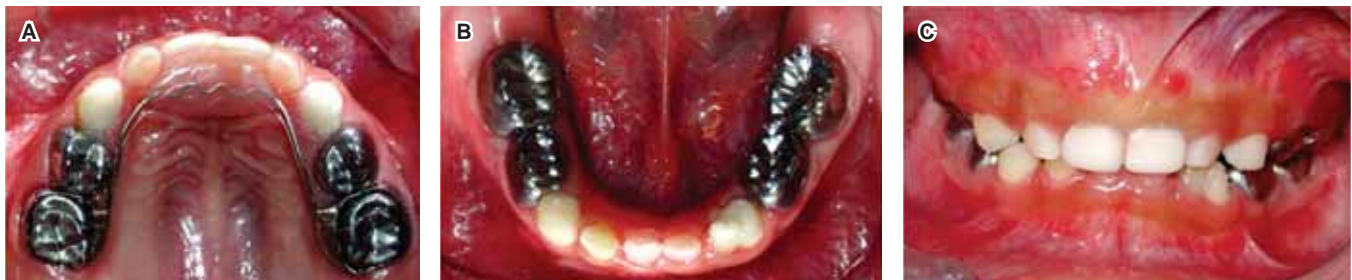
Figura 11. A, B, C. Fotografías finales anterior y oclusales Restauraciones con coronas de acero cromo en molares, resinas en caninos y frente estético.