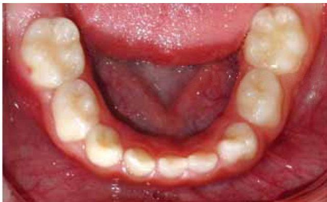
Figura 7. Oclusal inferior. Dentición temporal libre de caries. Fusión de diente 72 y 73.

en la literatura, se decide realizar los tratamientos recomendados por los diversos autores.