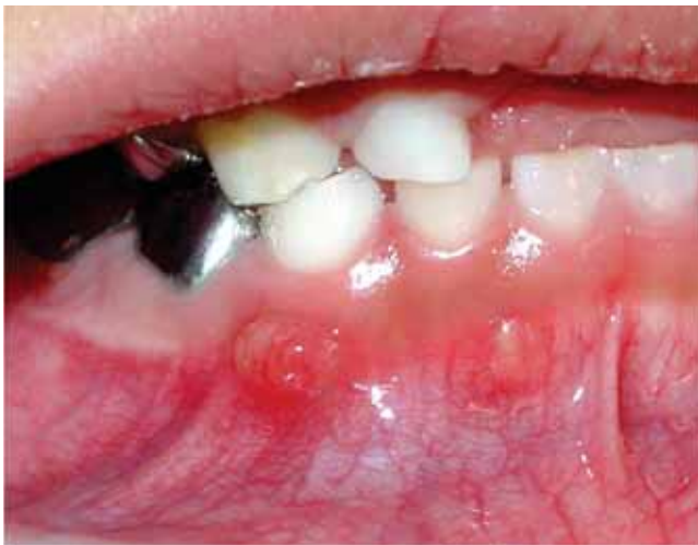
Figura 9. Absceso periapical en dientes 82 y 83.

Nuestro paciente presentó abscesos periapicales en los dientes 51 y 61; varias ocasiones que, según la madre, fue en ausencia de caries o trauma, y durante la exploración se observaron fístulas a nivel de los dientes 64 y 54 con salida de material purulento; sin embargo, no presentaban procesos cariosos ni cambio de color que nos indicara antecedentes de traumatismo dental. En cuanto a las cámaras pulpares agrandadas con cuernos que llegan hasta la unión amelodentinaria, fueron observadas en las ra-