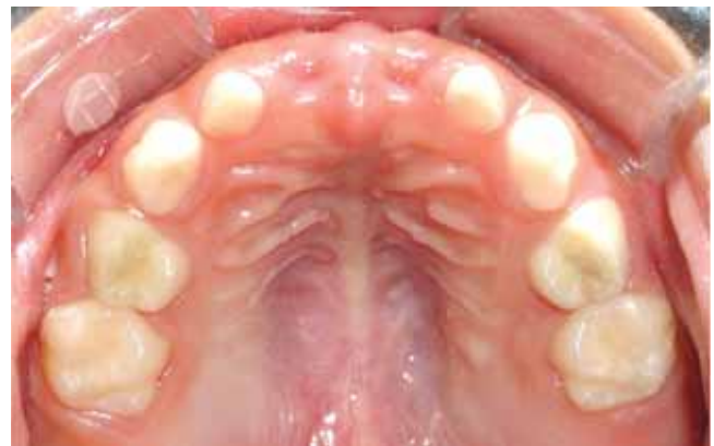
Figura 3. Oclusal superior. Dentición temporal libre de caries y ausencia de diente 51 y 61.