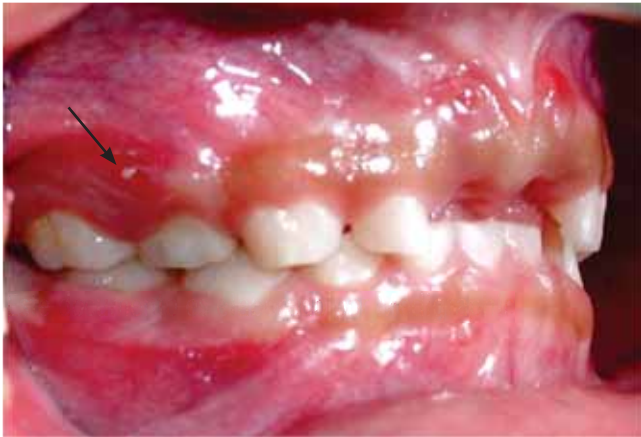
Figura 5. Lateral derecha. Fístula a nivel de órgano dentario 54 (flecha).