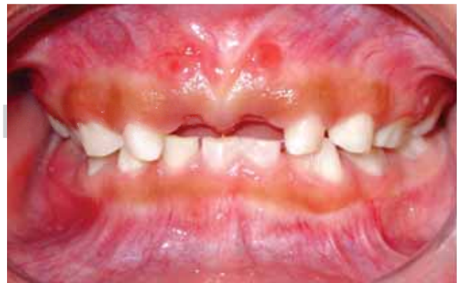
Figura 4. Vista anterior. Cicatrices de fístula en encía insertada a nivel de dientes 51 y 61.