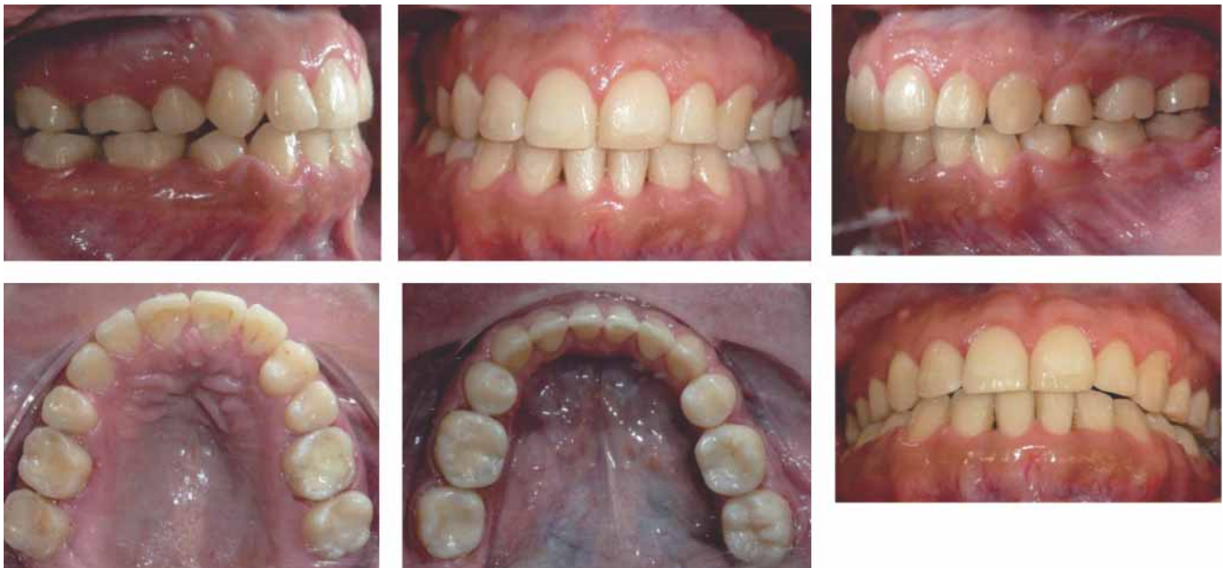
Figura 5. Fotografías intraorales finales. Se sustituyeron el canino superior derecho y el primer molar inferior izquierdo, se conservó la clase III molar derecha y se consiguió clase I molar izquierda, y debido a la desviación mandibular, no se consiguió la clase I canina derecha ni la coincidencia de las líneas medias.