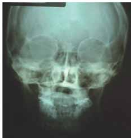
Figura 3. Ortopantomografía, lateral de cráneo y postero-anterior iniciales. Se aprecia el canino superior derecho retenido, la impactación mesial del tercer molar inferior izquierdo y la asimetría mandibular a nivel de cóndilos.