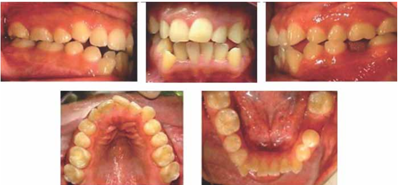
Figura 2. Fotografías intraorales iniciales donde se aprecian la clase III molar derecha, clase II canina izquierda, la discrepancia entre líneas medias dentales, la ausencia del primer molar inferior izquierdo y del canino superior derecho, así como el apiñamiento moderado y el desgaste en las coronas posteriores.