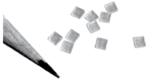
Figura 3. Comparación de dosímetros con la punta de un lápiz.

Una vez que recibieron la radiación ionizante los dosímetros termoluminiscentes se rotularon con las diferentes tomas radiográficas realizadas tanto del operador como el del paciente; después de ser radiados se realizó el proceso de lectura de los dosímetros