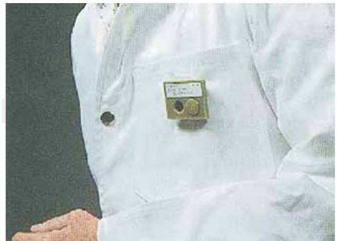
Figura 4. Dosímetro empleado en el operador.