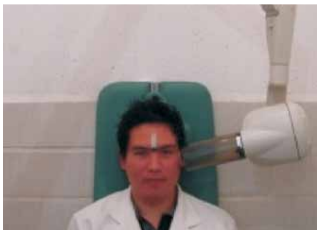
Figura 5. Toma de radiografía dentoalveolar.

termoluminiscentes en un cuarto oscuro con atmósfera de nitrógeno de alta pureza, dejando reposar las placas dosimétricas 24 horas.