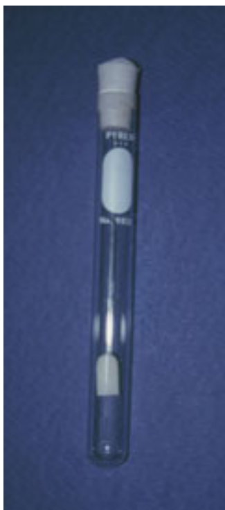
Figura 2. Muestra de PMMA con una superficie aproximada de 2.76 cm 2 , de acuerdo con el conformador IPS-CORUM SHA-DE TAB (Ivoclar).