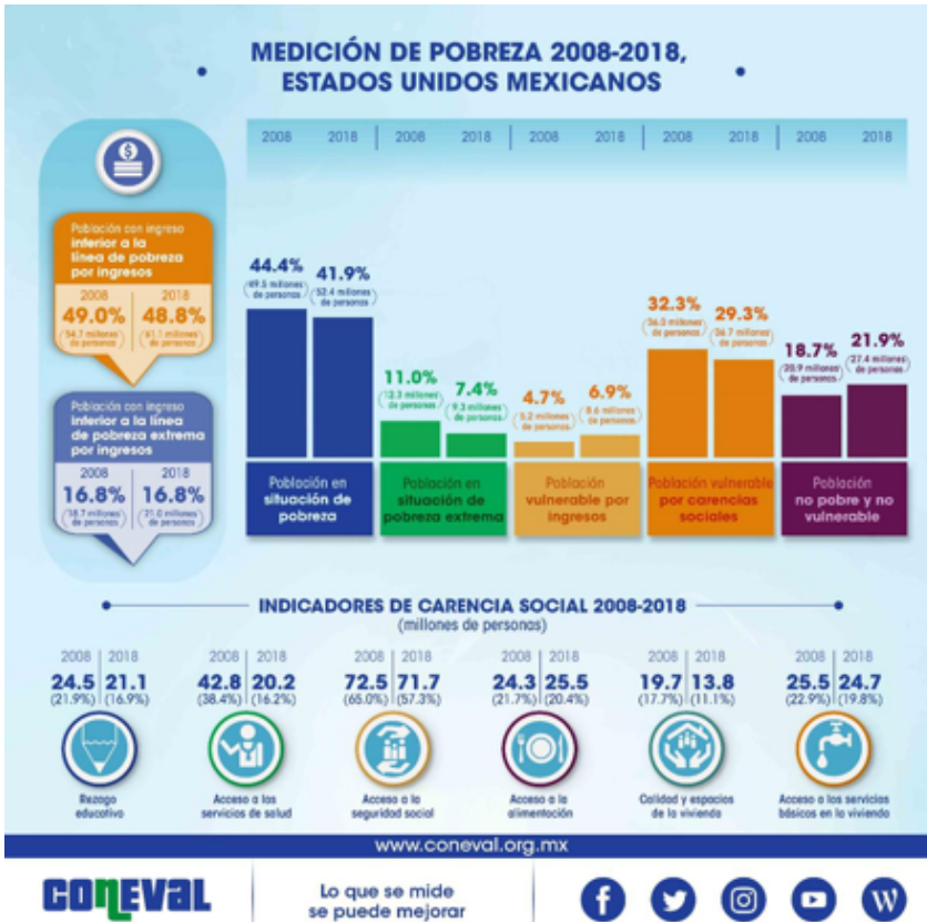
Imagen 1. Medición de pobreza 2008-2018. México

Fuente: CONEVAL, "Pobreza en México 2018" https://www.coneval.org.mx/Medicion/MP/Paginas/Pobreza-2018.aspx