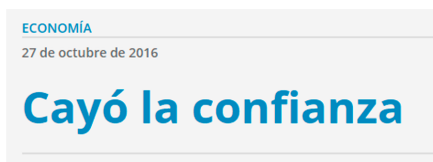
Figura 2. Fragmento de la primera página del informe de resultados del ICC de octubre de 2016.

E s la caída que registró la confianza de los consumidores en octubre frente al mismo mes de 2015, según el relevamiento de la Universidad Torcuato Di Tella (UTDT), aunque frente a septiembre se produjo un repunte del 6,3%. El estudio arrojó una mejora mensual tanto entre los sectores de menores recursos, entre los que trepó 5,8% en relación a setiembre, como en la de los estratos de mayores ingresos, donde subió 6,8%.