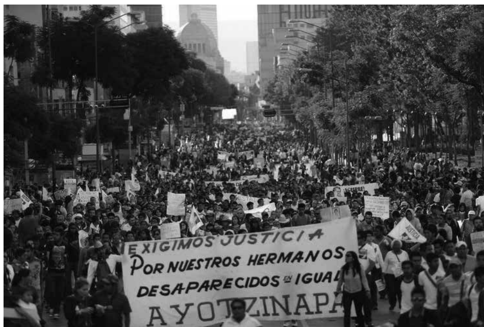
Foto 1. Marcha del 8 de octubre de 2014, Primera movilización por Ayotzinapa.

Como puede apreciarse en la Foto 1, lo dominante en la primera movilización por el caso Ayotzinapa es la exigencia de justicia (esto es, no es un reclamo nada más: es una exigencia). Destacan las pancartas espontáneas, escritas a mano en cartulinas de varios colores. En la marcha predomina la indignación, la denuncia y la exigencia de justicia, como se expresaba, por ejemplo, en algunas consignas: "La indignación en la calle", "Lo que pasó en Guerrero, que lo sepa el mundo entero", "Alerta que camina, la lucha estudiantil por América Latina" fueron algunas consignas que se gritaron en esta marcha.