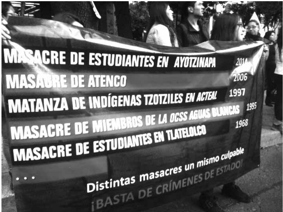
Foto 9. Marcha de 22 de octubre de 2014.

Como vemos en las Fotos 8 y 9, las denuncias de “matanza” y de “masacre” en las consignas de la marcha del 22 de octubre de 2014 denotan la rabia que moviliza; más importante aún: se construye la narrativa histórica, la historia de los “crímenes de Estado”, una genealogía que se remonta al movimiento estudiantil de 1968.