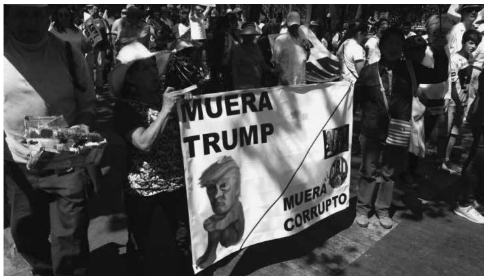
Foto 12. Marcha anti-Trump, febrero de 2017.

Quizá lo más emblemático de esta marcha fue la transformación del enojo en odio: de "Fuera Peña" a "Muera Peña" ("corrupto"), tal como se aprecia en la Foto 12: