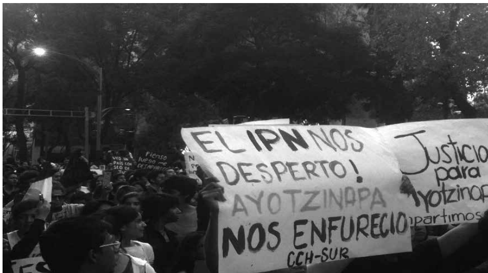
Foto 2. Marcha del 10 de octubre de 2014.

En la Foto 2 (marcha del 10 de octubre de 2014), vemos una pancarta que destaca por el soporte (una cartulina) y los colores vivos, llamativos. Lo importante es la expresión de la nueva emoción social: la furia: “Ayotzinapa nos enfureció”. También se observan la fusión de los temas: IPN y Ayotzinapa, con la coexistencia de los carteles. Destaca, nuevamente, la espontaneidad de los manifestantes, pues las pancartas no son corporativas o producidas en serie. También llama la atención la autoría de las pancartas, en este caso el CCH sur (Colegio de Ciencias y Humanidades [preparatoria] de la Universidad Nacional Autónoma de México, institución con larga y sólida trayectoria en los movimientos de protesta). Quienes están ahora en la calle son los preparatorianos (menores de 18 años).