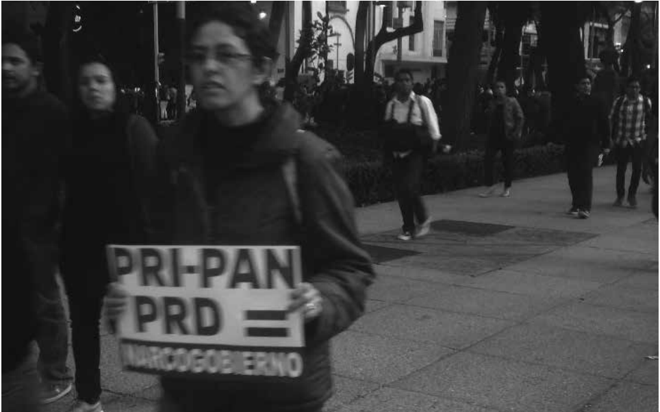
Foto 7. 22 de octubre de 2014, Primera Jornada Global por Ayotzinapa.