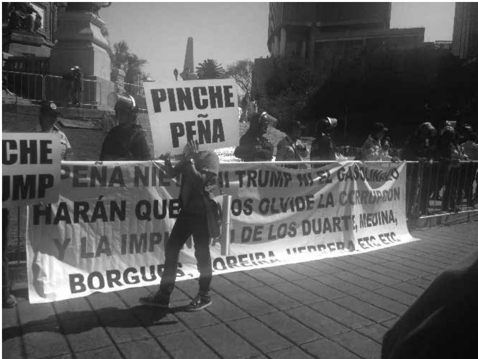
Foto 10. Marcha anti-Trump, febrero de 2017.

En la Foto 10 tenemos un ejemplo de una “doble pancarta” pero también de toda la narrativa que respalda el enojo, una “historia de heridas”; como decía Ahmed: “El enojo es un acto de habla direccionado hacia un sujeto, el enojo es performativo. Se crea como respuesta a un mundo, se vuelve una manera de moverse fuera del mundo criticado: se transforma en movimiento”. 52 Por eso vemos pancartas extensas, y no sólo sencillos eslóganes; se trata de pancartas que narran la herida y “espetan” el enojo.