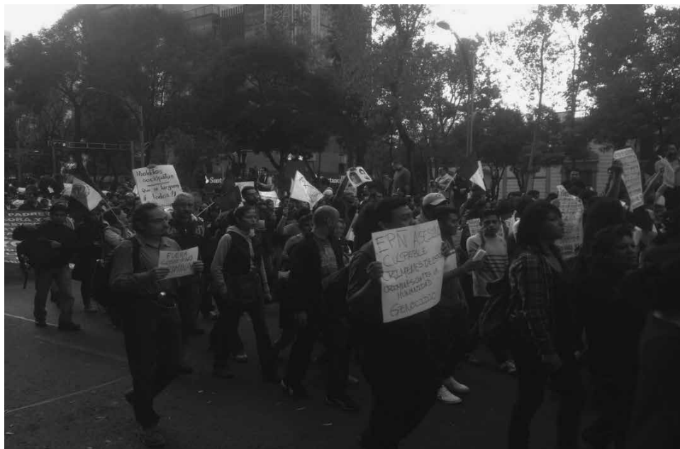
Foto 5. 22 de octubre de 2014, Primera Jornada Global por Ayotzinapa.

Nuevamente, en la Foto 5, tomada el 22 de octubre en la Primera Jornada Global por Ayotzinapa, se observan las pancartas confeccionadas a mano, en sencillas hojas de papel o en cartulinas, lo que denota la espontaneidad de los participantes. En esta marcha se hace presente otra emoción: la ira contra el presidente Enrique Peña Nieto, a quien se le llama "asesino". Las pancartas rezan: "EPN asesino, culpable, crímenes de estado, crímenes contra la humanidad, genocidio", "Fuera Gobierno criminal", "Malditos sociopatas, ¡que se larguen todos!"