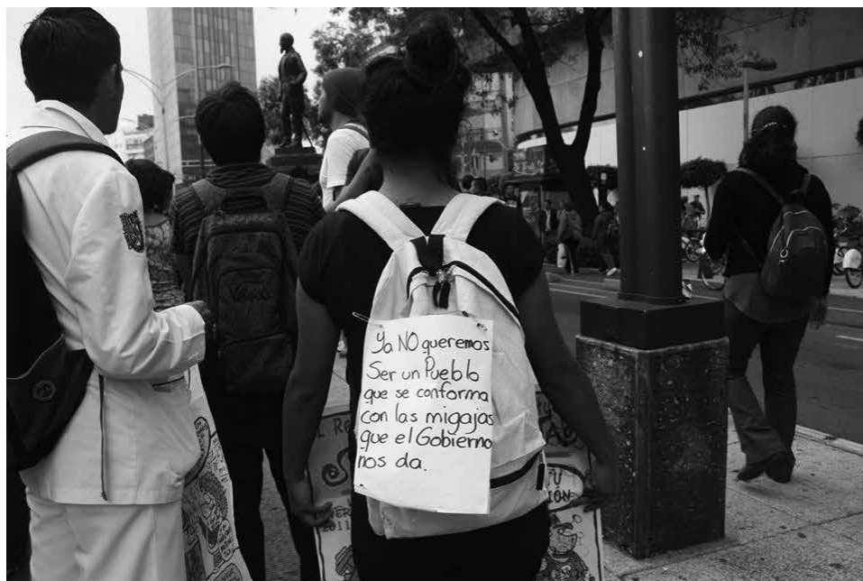
Foto 3. 22 de octubre de 2014, Primera Jornada Global por Ayotzinapa.

Como vemos en la Foto 3, en la primera Jornada Global por Ayotzinapa, del 22 de octubre de 2014, las emociones sociales ya están escalando y las pancartas siguen siendo espontáneas, expresiones genuinas de las emociones de los participantes. Es frecuente ver a un participante con dos pancartas: una delante y otra colgada en sus prendas o mochila, como en la Foto 3, donde la consigna que reza la hoja es: "Ya no queremos ser un pueblo que se conforma con las migajas que el gobierno nos da". Es importante destacar que las pancartas usan la primera persona en plural: hablamos entonces de emociones colectivas (o socializadas) y de una comunidad afectiva que las comparte. El "clima emocional" ya estaba formado; empezó con la indignación, la ira, la inconformidad. En palabras de Barbalet: "Las personas que comparten las mismas circunstancias pueden experimentar emociones comunes (...) El clima emocional es un fenómeno grupal, que se forma a través de las relaciones de los miembros del grupo". 48 Así pues, se puede explicar la espontaneidad de las pancartas-cartulinas escritas a mano.