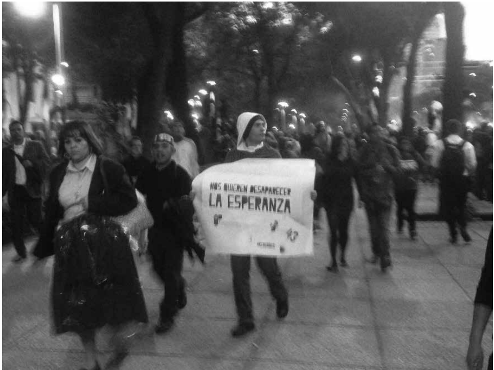
Foto 4. 22 de octubre de 2014, Primera Jornada Global por Ayotzinapa.

Es interesante el reclamo en la pancarta de la Foto 4: “Nos quieren desaparecer la esperanza”. Se hace un juego de palabras entre un tema central de las protestas (la desaparición de los 43 normalistas en Iguala, estado de Guerrero) y un estado de ánimo, la esperanza, sin objeto preciso. Puede interpretarse que lo expresado en esta pancarta son otras emociones: frustración y ansiedad (de las emociones que se midieron en la etapa cuantitativa).