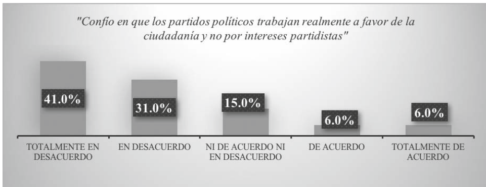
Gráfico 4. Confianza en el trabajo de los partidos políticos de Colima

Una de las respuestas más representativas del cuestionario fue cristalizada en un marcado consenso de desconfianza en el trabajo que realizan los distintos partidos. 42% dice estar totalmente en desacuerdo con la premisa de que los partidos políticos trabajan en favor de la ciudadanía y no por intereses partidistas. Posteriormente, en la misma línea de desaprobación, 31% menciona estar sólo en desacuerdo; 15%, ni de acuerdo ni en desacuerdo; en último término, las opciones de acuerdo y totalmente de acuerdo con el mismo planteamiento, ambas con 6% (véase Gráfico 4).