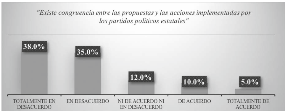
Gráfico 5. Conformidad en las acciones partidarias

En relación con la congruencia entre las propuestas de los partidos y las acciones implementadas por ellos, si los partidos demuestran congruencia entre las propuestas y las acciones implementadas, un 38% se posiciona en total desacuerdo con lo anterior, 35% afirma estar en desacuerdo, 12%, ni de acuerdo ni en desacuerdo, 10% de acuerdo y, finalmente, 5% está totalmente de acuerdo (véase Gráfico 5).