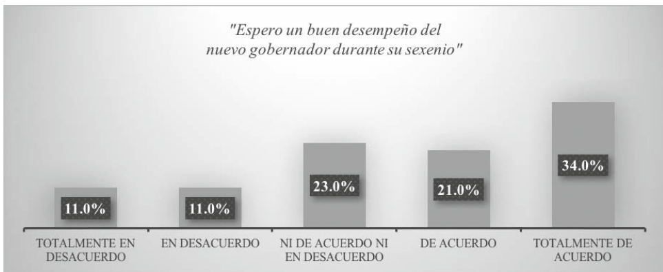
Gráfico 1. Esperanza en el trabajo del nuevo gobernador

El caso particular de la nueva administración del gobierno del estado de Colima representa un contexto lleno de contrastes. Respecto de la figura del nuevo gobernador, se observa una cierta esperanza ciudadana en él cuando una mayoría, representada por 34% del total, asegura estar totalmente de acuerdo con que espera un buen desempeño durante el sexenio que se inició recientemente. 23% considera posicionarse ni de acuerdo ni en desacuerdo con que lo logre, mientras que 21% afirma estar de acuerdo. En el último puesto, las opciones de totalmente en desacuerdo y en desacuerdo figuran con 11% (véase Gráfico 1).