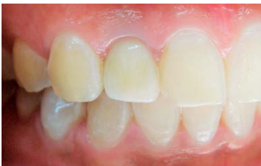
Figura 9. Restauración final atornillada.

son el espesor del tejido y el material del pilar. 14,15 Este reporte de caso evidencia el impacto de la modificación del color sobre la parte submucosa de un pilar en zirconio, logrando un resultado estético favorable.