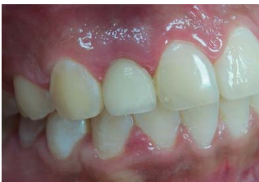
Figura 1. Vista inicial intraoral.

Anestesia local infiltrativa (lidocaína clorhidrato al 2% roxicaína) fue aplicada en la zona del incisivo lateral superior derecho, después de esto la exodoncia preservando el alvéolo ( Figura 3 ). Se coloca un implante Replace