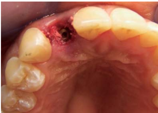
Figura 4. Posición 3D del implante.

Basados en la evidencia científica, los parámetros que influyen en el color de la mucosa periimplantar