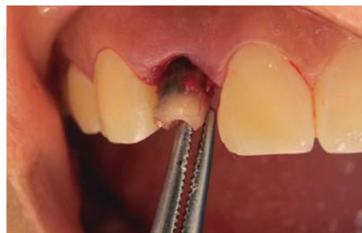
Figura 3. Exodoncia preservando alvéolo.