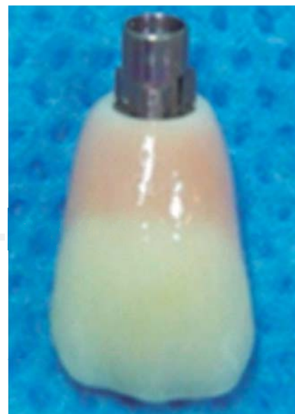
Figura 7. Pilar con cerámica rosada.