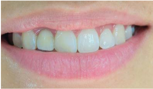
Figura 8. Mucosa periimplantar grisácea.