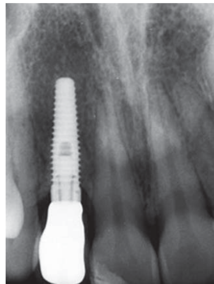
Figura 6. Radiografía periapical.