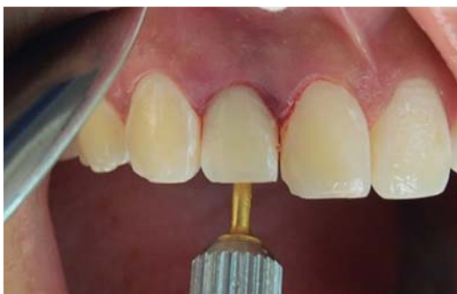
Figura 5. Restauración temporal.