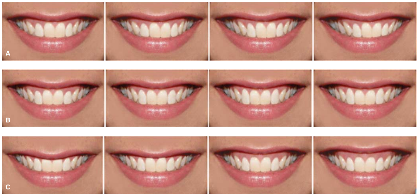
Figura 2. A) Modificaciones para «línea media». B) Modificaciones para «margen gingival». C) Modificaciones para «exposición gingival».