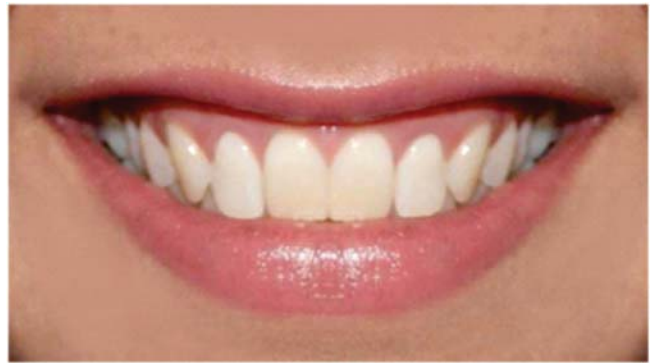
Figura 1. Fotografía de la sonrisa con parámetros estéticos de normalidad.

Línea media: se diseñaron cuatro imágenes con desviación de la línea media dental, de 1 a 4 mm hacia la derecha.