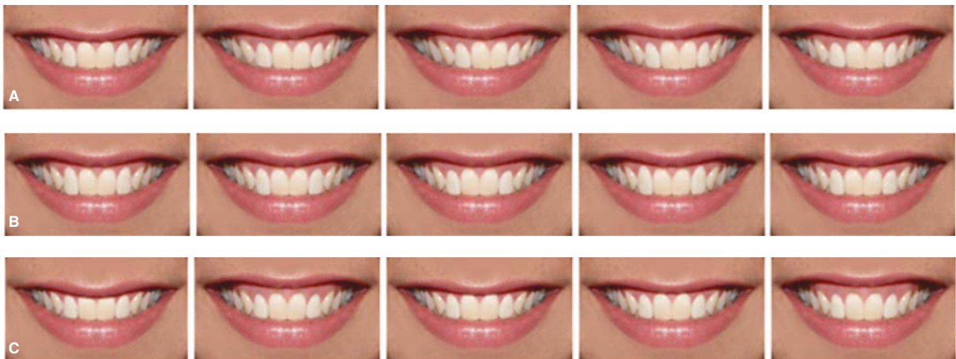
Figura 3. Modificaciones para cada parámetro, colocadas en orden aleatorio. A) Línea media. B) Margen gingival. C) Exposición gingival.