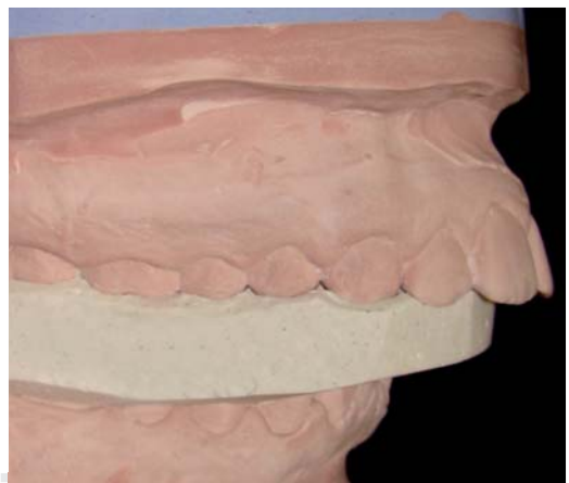
Figura 6. Fijación del seguro de céntrica en el vértice del trazo (relación céntrica).