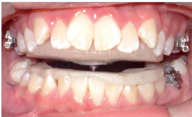
Figura 4. Platinas para registro de relación céntrica con la técnica trazo de arco gótico.