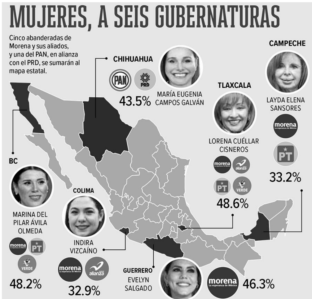
Imagen 2 Gobernadoras tras el año 2021