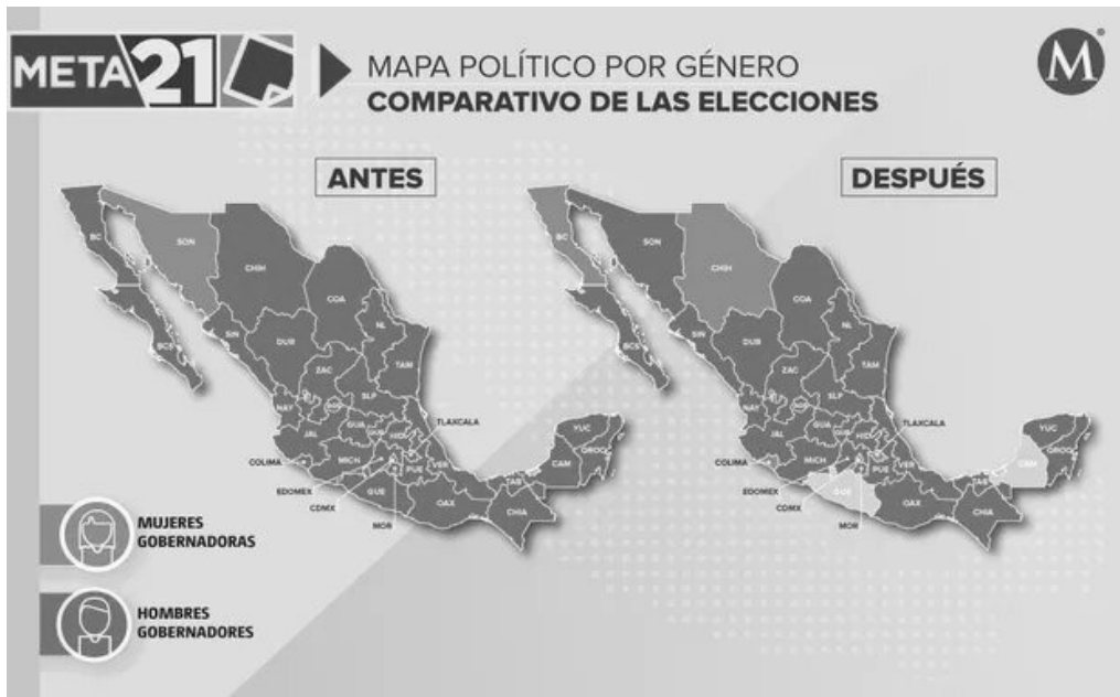
Imagen 1 Mapa gobernadoras antes del 2021

Para finalizar este apartado sobre gobernadoras en la historia se presenta un mapa (Imagen 1) que muestra las gobernadoras previo a las elecciones de 2021, esto es, únicamente 2 de 32 entidades federativas. En contraste, se presentará posteriormente un mapa tras las elecciones del 6 de junio, donde se aprecian los estados que hoy se encuentran gobernados por mujeres.