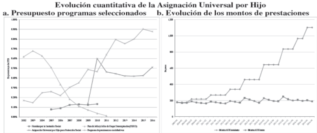
Gráfica 2 Asignación familiar por hijo