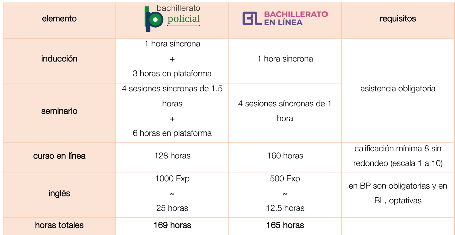
Tabla 1. Número de horas del proceso de formación docente. Elaboración propia

A continuación, se presenta el desglose en horas de formación para cada uno de los programas, así como los requisitos correspondientes.