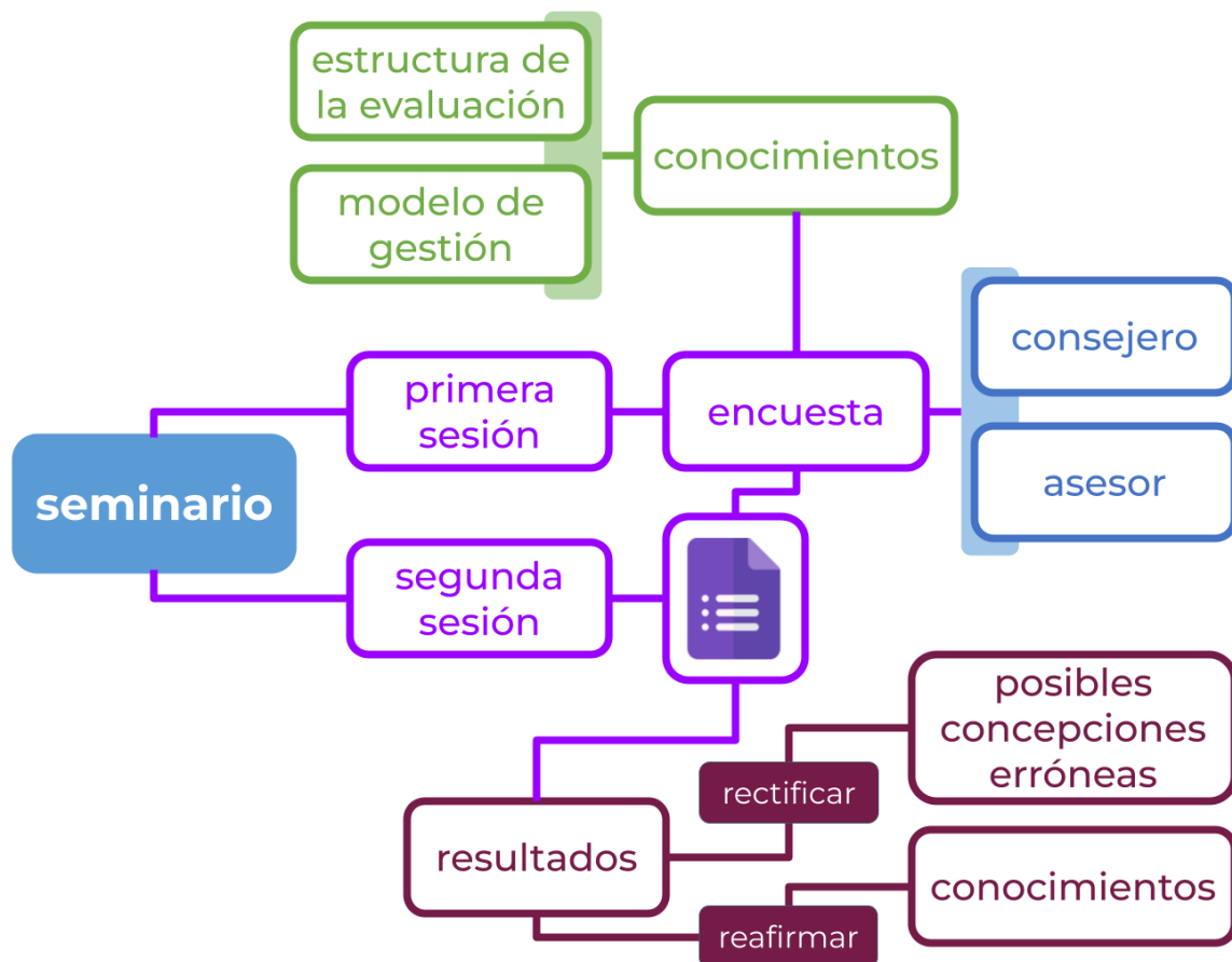
Figura 3. Etapas del seminario. Elaboración propia.

Durante todo el tiempo que el docente se encuentra en el proceso de formación e impartiendo la asignatura cuenta con un canal abierto de comunicación mediante la plataforma Slack , a través del que puede no solo reportar incidencias en los contenidos y actividades de la asignatura, sino socializar dudas y prácticas que enriquecen el acompañamiento del estudiante.