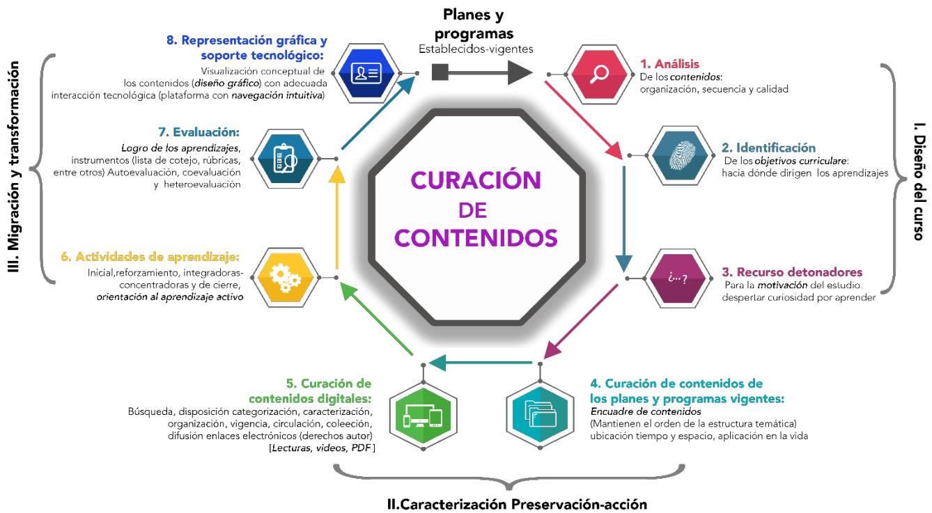
Figura 2. Modelo eficaz para la curación de contenidos en enseñanza mixta y no escolarizada de la UAEMéx. Elaboración propia.