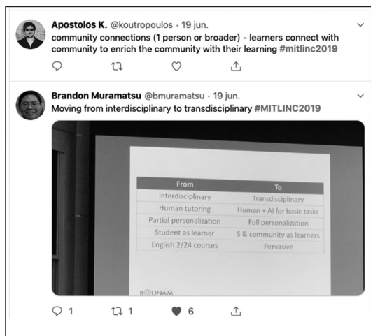
Figura 3. Comentarios en el hashtag del evento sobre la presentación de B@UNAM.