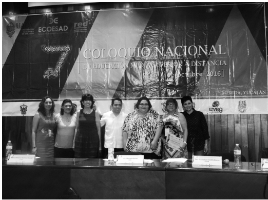
Figura 5. Mesa Panel