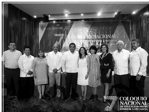
Figura 3. Inauguración