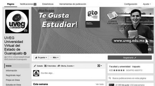
UVEG / Universidad Virtual del Estado de Guanajuato

En la actualidad la UVEG cuenta con dos Fan Page oficiales verificadas y validadas por Facebook (palomita en círculo): UVEG / Universidad Virtual del Estado de Guanajuato y Telebachillerato Comunitario de UVEG , tal como se muestra en la figura 4.