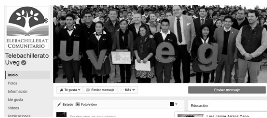
Telebachillerato Comunitario UVEG