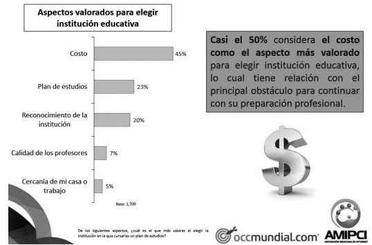
Figura 1. Panorama General de la Educación

A raíz de este estudio, la UVEG tomó en cuenta la información acerca de las necesidades de los interesados ante la educación 100% virtual, el tipo de oferta educativa y las dudas que en general pudieran llegar a tener los usuarios. A partir de entonces, se ha buscado generar publicaciones que forjen un mayor engagement con los usuarios.