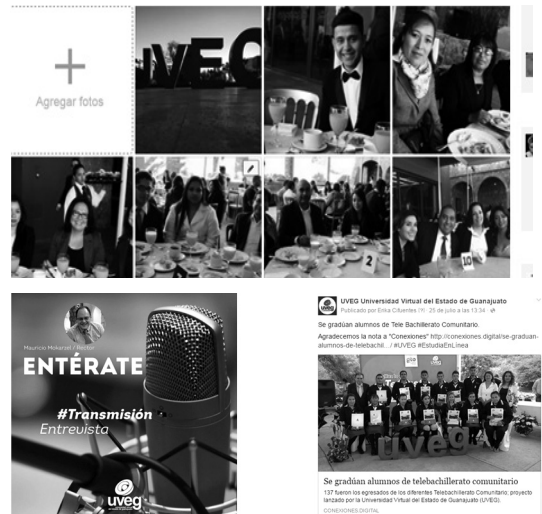
Figura 3. Ejemplos de post compartidos en la Fan Page de la UVEG (de izquierda a derecha y de arriba hacia abajo: XII Ceremonia de Egreso; Firma de convenio con VISE; Entrevista a Rector; Egreso de alumnos de TBC).

Todo lo anterior nos permite hacer un cruce de información para identificar el tipo de contenido que genera más engagement entre los usuarios y por ende, una mayor identidad y sentido de pertenencia, como se muestra en los siguientes comentarios (véase figura 3):