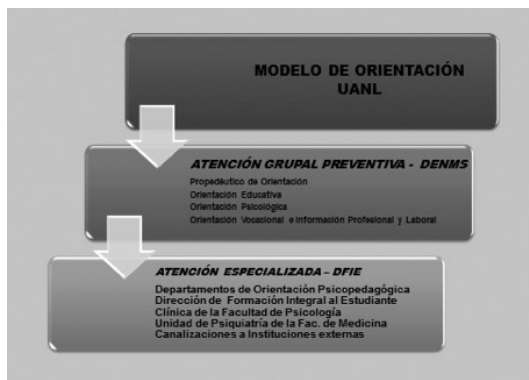
Figura 2. Modelo de Orientación de la UANL.

El Modelo de Orientación también se fundamenta en los aportes teóricos de Bisquerra (2005, 2009, 2012), retomando su concepto de orientación integrado por la atención a tres áreas: educativa, desarrollo personal y vocacional. Asimismo, se retoman sus aportaciones sobre la relevancia de la educación emocional en el ámbito académico (Bisquerra, 2009), aspecto que se busca apoyar con la Unidad de Aprendizaje de Orientación Psicológica en el segundo semestre. En la figura 2 puede observarse el Modelo de Orientación en la UANL, tanto para la atención preventiva, como para la atención especializada: