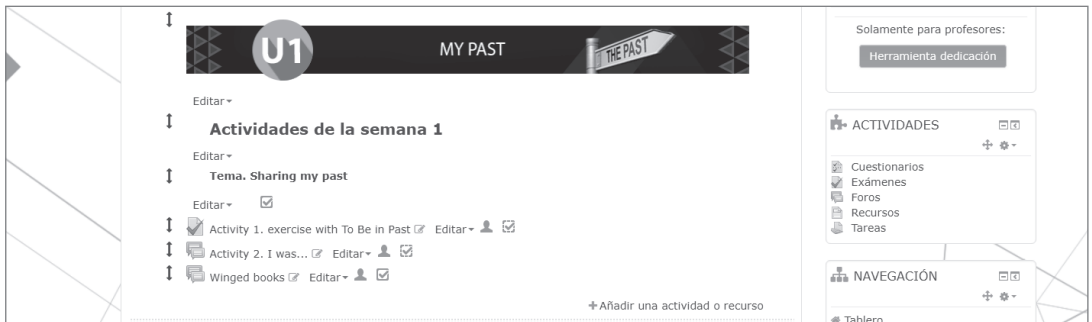
Figura 1. The winged book en un curso regular

En el transcurso de la asignatura, todos los participantes (tutor y alumnos) realizan un continuo intercambio de libros, principalmente de biografías en inglés, buscando que éstos sean lo suficientemente accesibles para su nivel de entendimiento del idioma (Figura 1). A lo largo del curso, los participantes, de forma individual, escogen un libro alado (virtual) cada 15 días. Durante este lapso, su principal labor consistirá en leerlo, extraer nuevo vocabulario y generar una imagen (collage) del aprendizaje que han logrado gracias a la lectura de esa biografía.