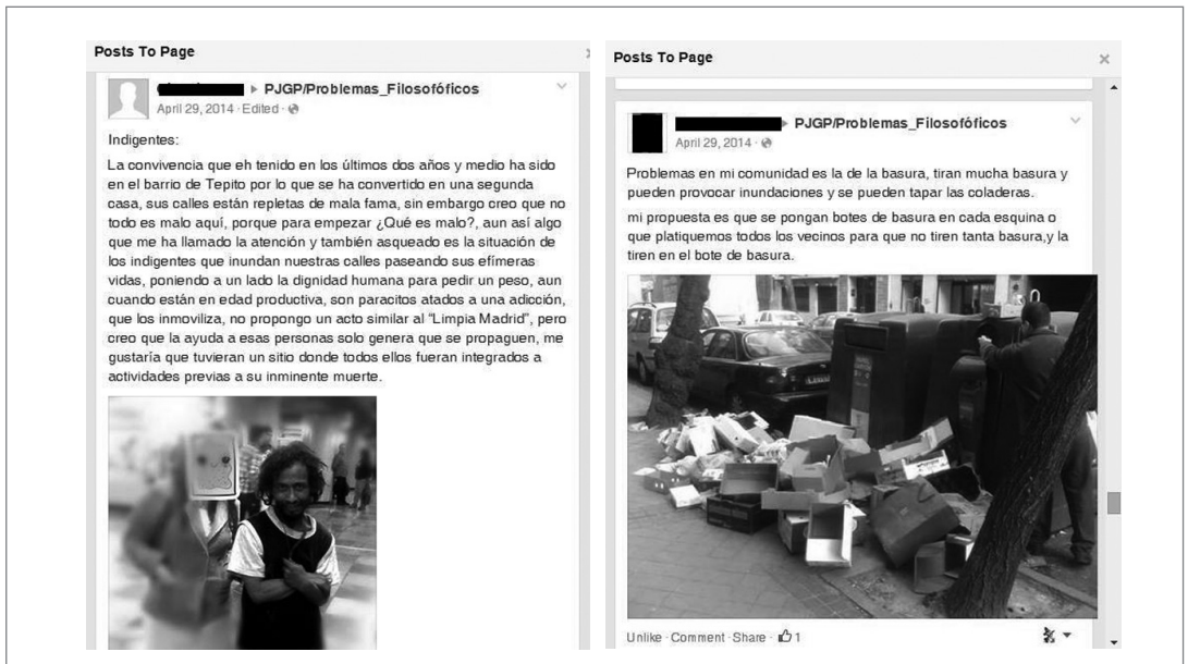
Figura 1. Dos ejemplos de post en página de Facebook en torno al tema de racionalidad política.

mos de una manera más profunda que va más allá de la satisfacción de necesidades inmediatas instintivas” 5