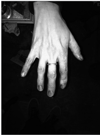
Imagen 2. Ejemplos de fotografías presentadas por los alumnos y el cartel del acto.