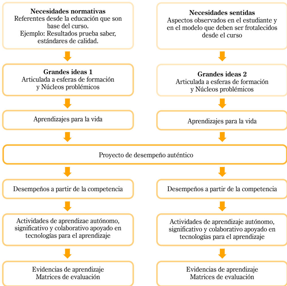
Figura 4: Diseño del Curso.