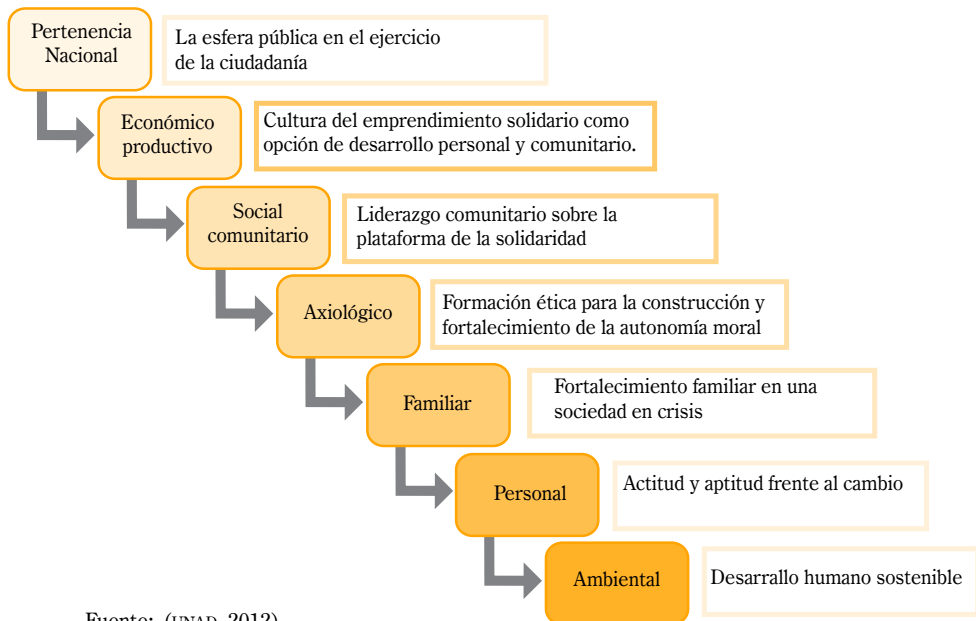
Figura 1: Núcleos Problémicos, Propuesta Curricular.

La propuesta curricular parte de los lineamientos y estándares del Ministerio de Educación Nacional, de acuerdo con las características y necesidades propias de la población implica la construcción de una red curricular a partir de núcleos problémicos, competencias, ejes temáticos y nuevos escenarios de interacción, dinamizados por procesos de investigación formativa, abordando problemas contextuales de los jóvenes y adultos en di-