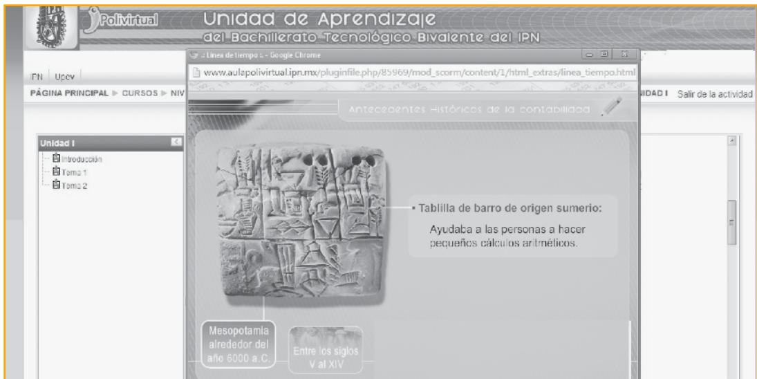
Imagen 1. Página principal de la unidad de aprendizaje Contabilidad I, unidad I, tema 1.1. [Captura de pantalla].