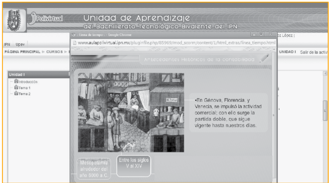
Imagen 2. Página principal de la unidad de aprendizaje Contabilidad I, unidad I, tema 1.1, [Captura de pantalla].