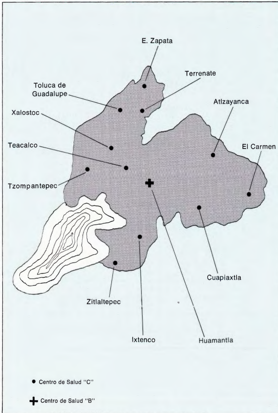
Fig. 2 Distribución de establecimientos de salud de la S.S.A. en la Jurisdicción Sanitaria de Hamantla, Tlaxcala