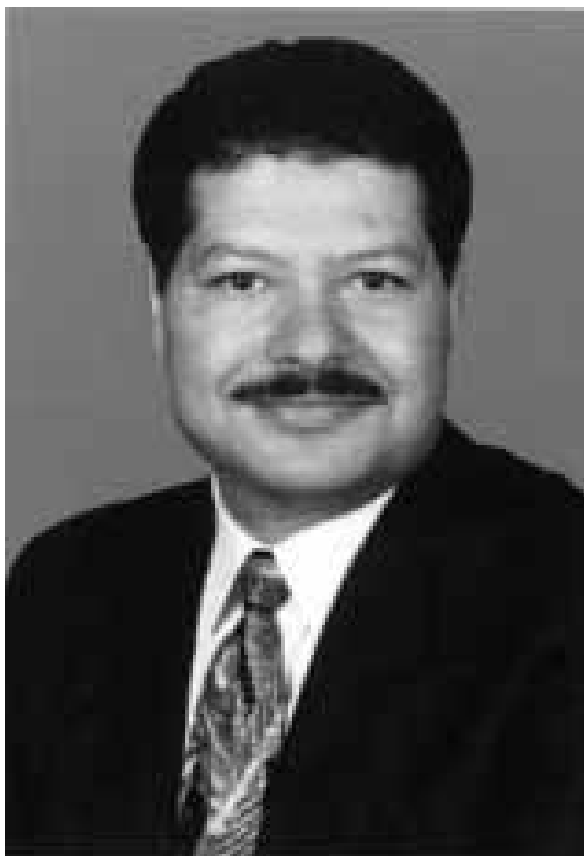
Figura 3. Ahmed Zewail, el amo de la femtoquímica.

dor de un kilómetro por segundo y son tan pequeños que medimos sus posiciones relativas con una unidad llamada el ångström, que es 10^{-10} metros –una diez mil millonésima de un metro. Un enlace químico típico es de unos cuantos ångströms de largo. Si usted combina estos números puede ver que le toma unos 100 femtosegundos moverse a un átomo una distancia de un ångström. Así que tenemos que ser sustancialmente más rápidos que eso para pillarlos en el acto”. Después comenta Zewail cómo se construye un haz molecular sobre el cual actúe un rayo láser que debe ser capaz de detectar eventos moleculares en unos cuantos femtosegundos. (Para ver el