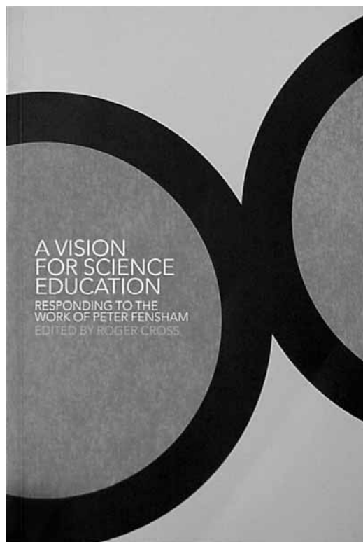
Figura 3. Portado del libro de Roger Cross, en honor a Peter Fensham.

Cuando logremos cambiar el paradigma de la enseñanza científica hacia ese «empoderamiento a partir de la ciencia» y con base en él seleccionemos los contenidos y la pedagogía de la ciencia escolar, llegará el momento en que podamos por supuesto alcanzar el Ciencia para todos nuestros futuros ciudadanos (Fensham, 1995, p. 54). ▀