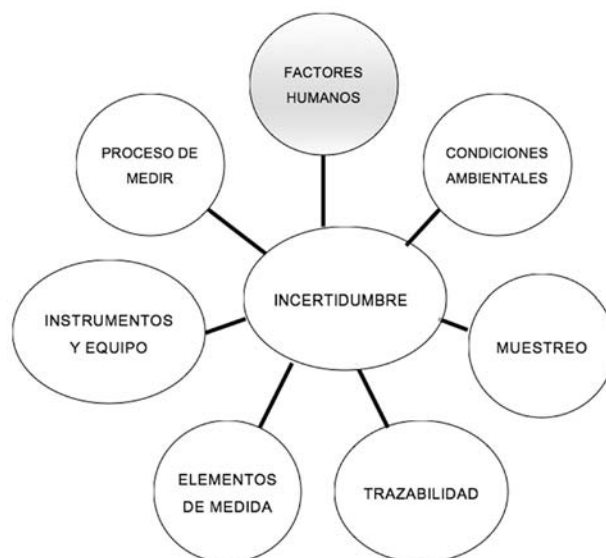
Figura 2. Factores que determinan el desarrollo confiable del trabajo experimental y contribuyen a la incertidumbre de medición.

Este rubro se refiere a las actividades de transportación, recepción, manejo, protección, almacenaje, retención y/o disposición final de los elementos del proceso de medición, incluyendo todas las provisiones necesarias para proteger la integridad de cada uno de los elementos. Se requiere conocer de manera objetiva (con la participación de la estadística) si este manejo produce un efecto en el resultado final, y si es necesario corregir y estimar la contribución a la incertidumbre de medición.