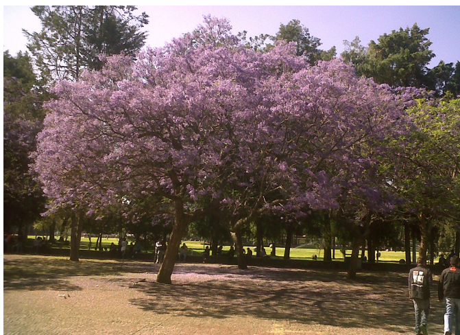
Jacaranda frente a la Facultad de Derecho, a un lado de “las islas”, en el centro del circuito escolar de Ciudad Universitaria.

universitarios contribuirán a que nuestra gente viva mejor, sea mejor; más solidaria, más comprometida, más persona, más humana, más justa y también más feliz.