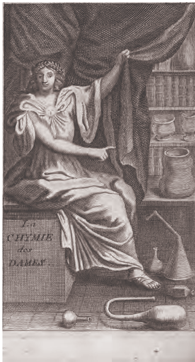
Figura 2 Portada de La Chymie charitable et facile en faveur des dames (1687).

Se conocen dos ediciones de La Chymie charitable et facile en faveur des dames , en 1687, 30 años después de la