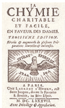
Figura 1 Portada de La Chymie charitable et facile en faveur des dames (1687).

importante en varias décadas, con ocho ediciones francesas, en 1656, 1666, 1674, 1680, 1683, 1687, 1711 y 1787, seis alemanas publicadas de 1674 a 1738 y una italiana, Chimica caritativole e facile per le signore (1682). Para nuestro estudio hemos escogido la de París de 1687 de La Chymie charitable et facile en faveur des dames , que incluye 292 recetas (fig. 1).