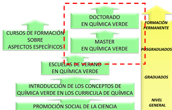
Figura 1. Principales actividades formativas en Química Verde consideradas por la REDQS.

La creación y mantenimiento de un programa integrado y cooperativo de formación de posgrado en Química Sostenible ha sido un proceso complejo. Por un lado, la necesidad de interaccionar con distintas instituciones académicas que, en España, poseen un grado de autonomía muy elevado y que, por lo tanto, pueden poseer regulaciones y políticas educativas diferenciadas. Por otro lado, puesto que en el modelo legal español la autorización de titulaciones es una competencia atribuida a las Comunidades Autónomas (gobiernos regionales) ha sido necesario obtener las autorizaciones correspondientes mediante procesos que en algunos casos presentaban variaciones importantes. Este proceso de autorización ha requerido, además, la aprobación de la titulación correspondiente por un organismo de evaluación antes de su aprobación definitiva por el Estado Español. Finalmente, todo este proceso se ha tenido que realizar en el