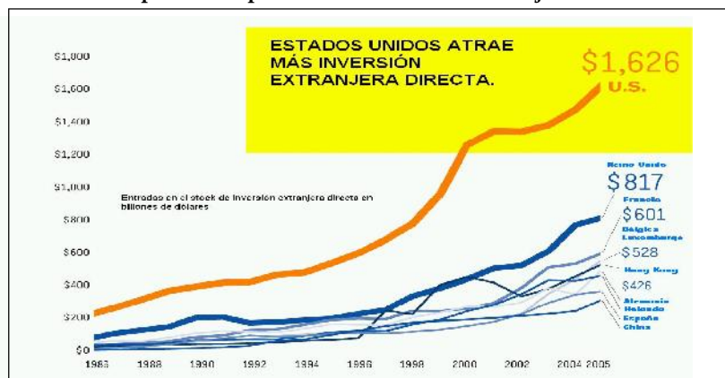
GRÁFICA 1 Principales receptores de inversión extranjera directa