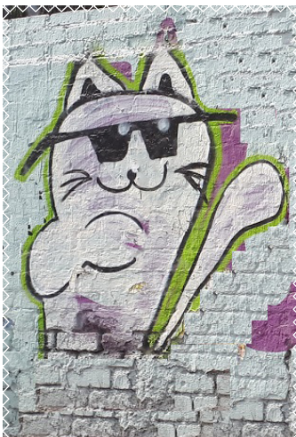
Grafito ando 2020