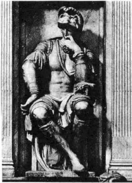
Fig 4 Miguel Ángel. Estatua de Lorenzo de Médicis