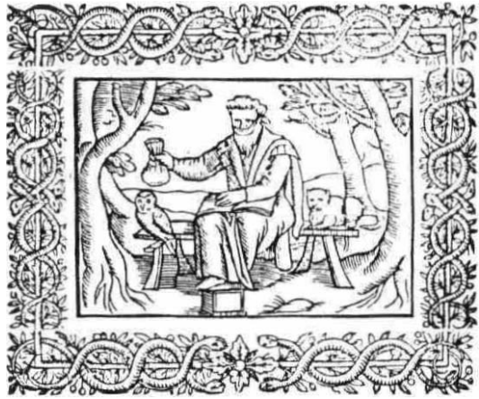
Fig 2 Melancholy. Henry Peacham. Minerva Britanna (1610)