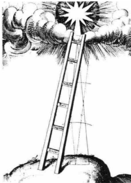
Fig 6 Escala de Jacobo Robert Fludd Ve Supernaturali, Naturali. Preternaturali /rContranaturali Microcosmi /istoria (1619)