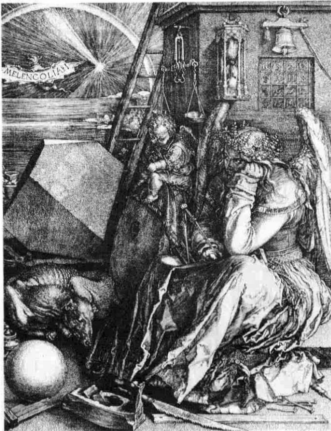
Fig. 3 Albrecht Dürer Melencolia I (1514)