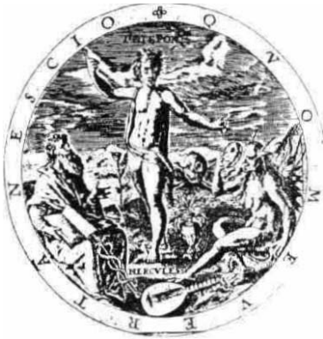
Fig. 1. George Wither. A Culleetian of Emblems (1635)