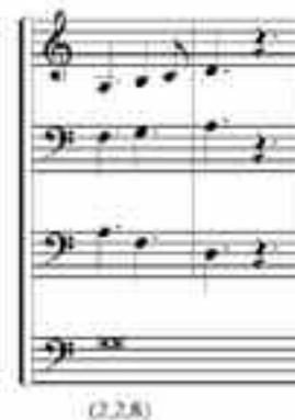
EJEMPLO 7B. SEDERUNT , SECCIÓN 6, COMPASES 105-106.