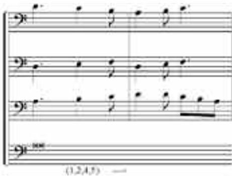
EJEMPLO 11. SEDERUNT , SECCIÓN 7, COMPASES 129A Y 129B.

La identidad (1,2,4,5) es característica de los compases de transición de la Sección 7 a la 8 (EJEMPLO 11):