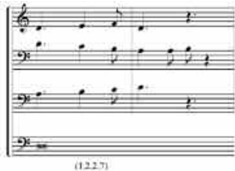
EJEMPLO 10. SEDERUNT , SECCIÓN 3, COMPASES 56A Y 56B.

La identidad (1,2,2,7) es característica de los compases que transitan de la Sección 3 a la 4 (EJEMPLO 10):