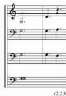
EJEMPLO 7A. SEDERUNT , SECCIÓN 6, COMPASES 95-96.