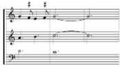
EJEMPLO. 13 GARRIT GALLUS, COMPASES 8 A 10.

reposos rítmicos en las cadencias. Vitry recurre siempre a la quinta justa en las resoluciones de las cadencias, lo que explica la mayor presencia temporal de (5,7) sobre otras identidades. (EJEMPLO 13)