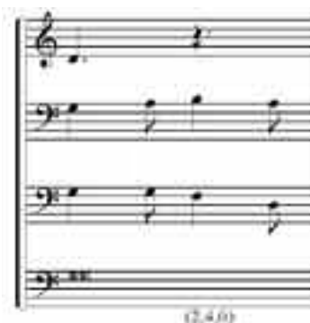
EJEMPLO 8. SEDERUNT , SECCIÓN 6, COMPÁS 98.