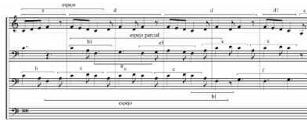
EJEMPLO SECCIÓN 4. SEDERUNT PRINCIPES PEROTIN , COMPASES 57 A 62