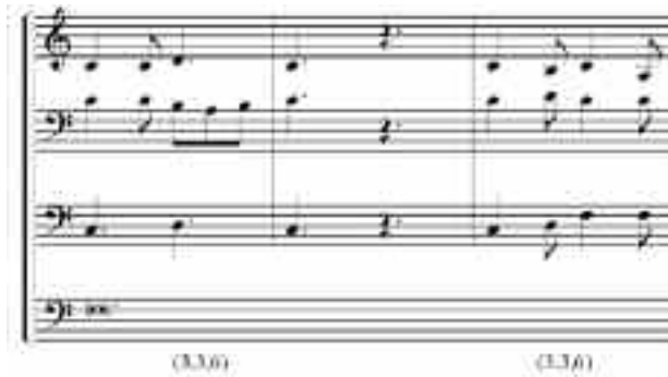
EJEMPLO 9. SEDERUNT , COMPASES 67 A 69.

La identidad (3,3,6) aparece en la sección 4; marca el final de las permutaciones motivicas y el inicio de los compases de transición a la Sección 5 (EJEMPLO 9):