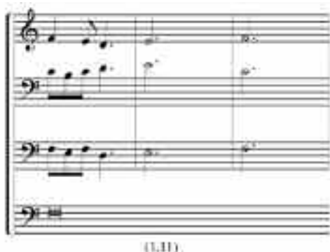
EJEMPLO 5. SEDERUNT , SECCIÓN 4, COMPASES 139 A 141.