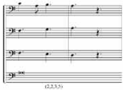
EJEMPLO 12. SEDERUNT , SECCIÓN 7, COMPASES 120 Y 121

Una vez observados varios de los momentos que mejor denotan la presencia de las identidades de intervalos en el presente análisis de Sederunt principes de Perotin, se