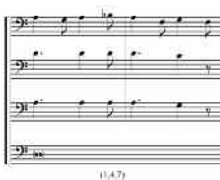
EJEMPLO 6. SEDERUNT , SECCIÓN 2, COMPASES 13 Y 14.

En los siguientes ejemplos se aprecia la distribución de las identidades en las distintas secciones de Sederunt . La identidad (1,11) –segunda menor o séptima mayor, FA-MI en la partitura– aparece casi exclusivamente para señalar el final de la primera parte de la obra, como se ve en el EJEMPLO 5; en cambio, en el EJEMPLO 6 se observa cómo la identidad (1,4,7) forma parte del patrón característico de la Sección 2; en los EJEMPLOS 7A y 7B se aprecian dos pequeños fragmentos, donde la identidad (2,2,8) marca el inicio y el final de la Sección 6, mientras que en el compás mostrado en el EJEMPLO 8 la identidad (2,4,6) forma parte de las sonoridades recurrentes que resultan de las permutaciones motivicas de dicha sección.