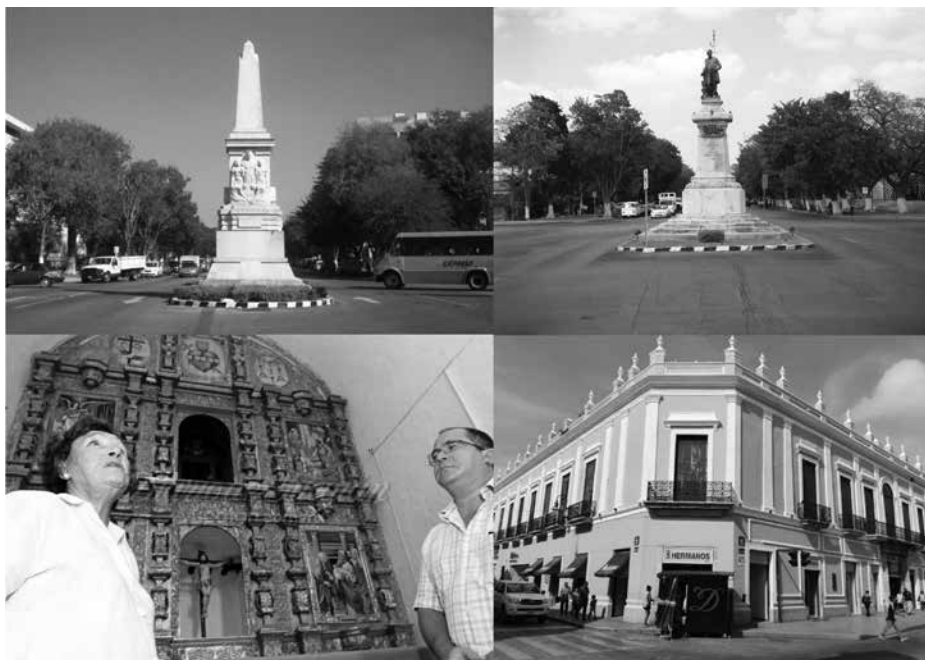
a) Remozamiento del monumento a Felipe Carrillo Puerto en el Paseo de Montejo, b) remozamiento del Monumento a Justo Sierra O' Reilly, también en el Paseo de Montejo, c) remozamiento del retablo de la Tercera Orden, d) remodelación de la casa del Gallito, frente a la Plaza Principal de Mérida.

La Asociación Yucateca de Especialistas en Restauración y Conservación se creó en 2009. Dentro de sus acciones más relevantes están las gestiones para revalorar el Cementerio General como área patrimonial y promover su saneamiento y rescate. Asimismo, ha realizado año con año seminarios de conservación del patrimonio en colaboración con el Ayuntamiento de Mérida y ha opinado públicamente sobre los problemas de conservación del centro histórico de Mérida.