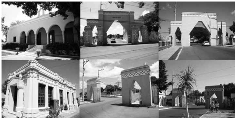
Fotografías de inmuebles y arcos de acceso al cementerio general de Mérida rescatados.

En 1988 se fundó el Plan Estratégico de Mérida, que después se denominó Plan Estratégico de Yucatán. Entre sus iniciativas más representativas en el centro histórico destaca el programa de la Bicirruta sobre el Paseo de Montejo y los proyectos de remodelación de la calle 59, entre el Parque de Santiago y el Parque de La Paz, que se realizaron con éxito. También promovió proyectos para peatones en la zona de monumentos y el proyecto de estación de camiones en los terrenos de La Plancha, las cuales no fueron realizados.