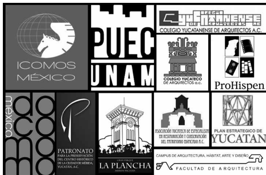
Figura 9. Logotipos de las diferentes asociaciones e instituciones que se han destacado en la conservación y restauración del centro histórico de Mérida y del patrimonio histórico de Yucatán

Concluimos señalando que las organizaciones sociales u organismos autónomos relacionados con la conservación del patrimonio en Yucatán y, particularmente, con el centro histórico de Mérida, han ido creciendo y consolidándose durante las últimas décadas, fomentando una mayor participación ciudadana en los asuntos públicos y una conciencia social sobre la materia. Su papel ha sido indudable en la reorientación de las políticas públicas y en la puesta en valor y relevancia que el centro histórico tiene como ámbito seguro y turísticamente reconocido mundialmente en los últimos años, al contribuir a crear condiciones de mayor inversión y rescate del espacio público mediante sus críticas, propuestas y colaboración con el poder público. Estas condiciones son imprescindibles para evaluar y consensar el quehacer público en la materia, acotando la discrecionalidad, improvisación e imprevisión de las propuestas del sector público, en sus diferentes niveles, respecto al destino de los proyectos urbanos y arquitectónicos del patrimonio yucateco que pertenece a todos por igual.