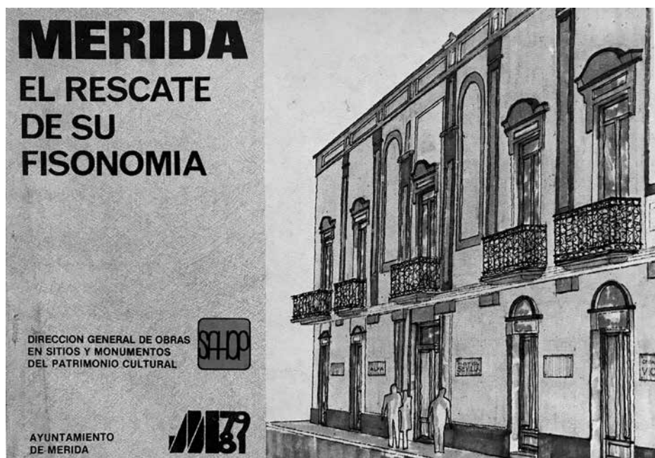
Figura 1. Portada del suplemento normativo editado por la Secretaría de Asentamientos Humanos y Obras Públicas y el Ayuntamiento de Mérida, 1979-1981

Mérida: El rescate de su fisonomía, con el fin de proporcionar orientación sobre la restauración de la arquitectura en el centro histórico de Mérida, dada la inexistencia de ordenamientos previos.