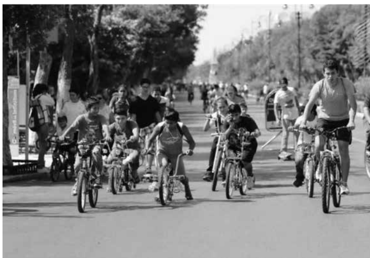
Figura 8. Iniciativa del programa dominical recreativo de la Bicirruta

Propuesta del Plan Estratégico de Mérida, mediante el arquitecto Fernando Medina Casares, implementada por el Ayuntamiento de Mérida en el Paseo de Montejo.