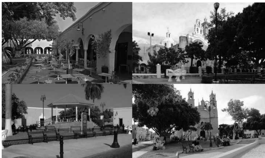
a) Plazuela de Santa Lucía, b) plazuela de San Cristóbal, c) plazuela de la Ermita y d) plazuela de San Sebastián.

La Asociación Adopte una Obra de Arte se fundó en 1996 con once miembros. Tiene un carácter filantrópico y sus principales actividades se han orientado a la restauración de monumentos. En el centro histórico han restaurado el Monumento a la Patria y los dedicados a Felipe Carrillo Puerto y Justo Sierra O' Reilly, todos en el Paseo de Montejo. También ha restaurado retablos de la iglesia de la Tercera Orden, de la Candelaria, así como el vitral de teatro José Peón Contreras, incluyendo la restauración de la fachada de la casa de El Gallito, frente a la Plaza Grande, entre las acciones más sobresalientes.