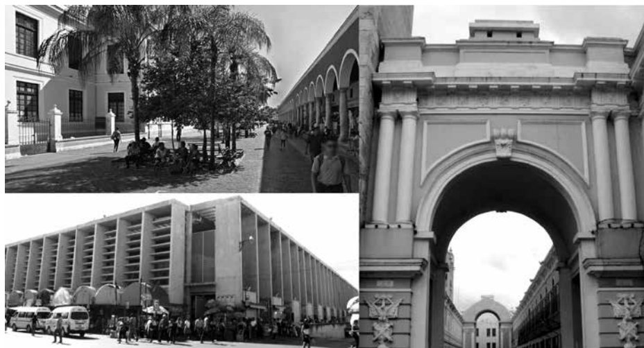
a) Rescate de la zona del mercado Grande, b) diseño y construcción del mercado de San Benito y c) reconstrucción de los arcos del Pasaje de la Revolución.