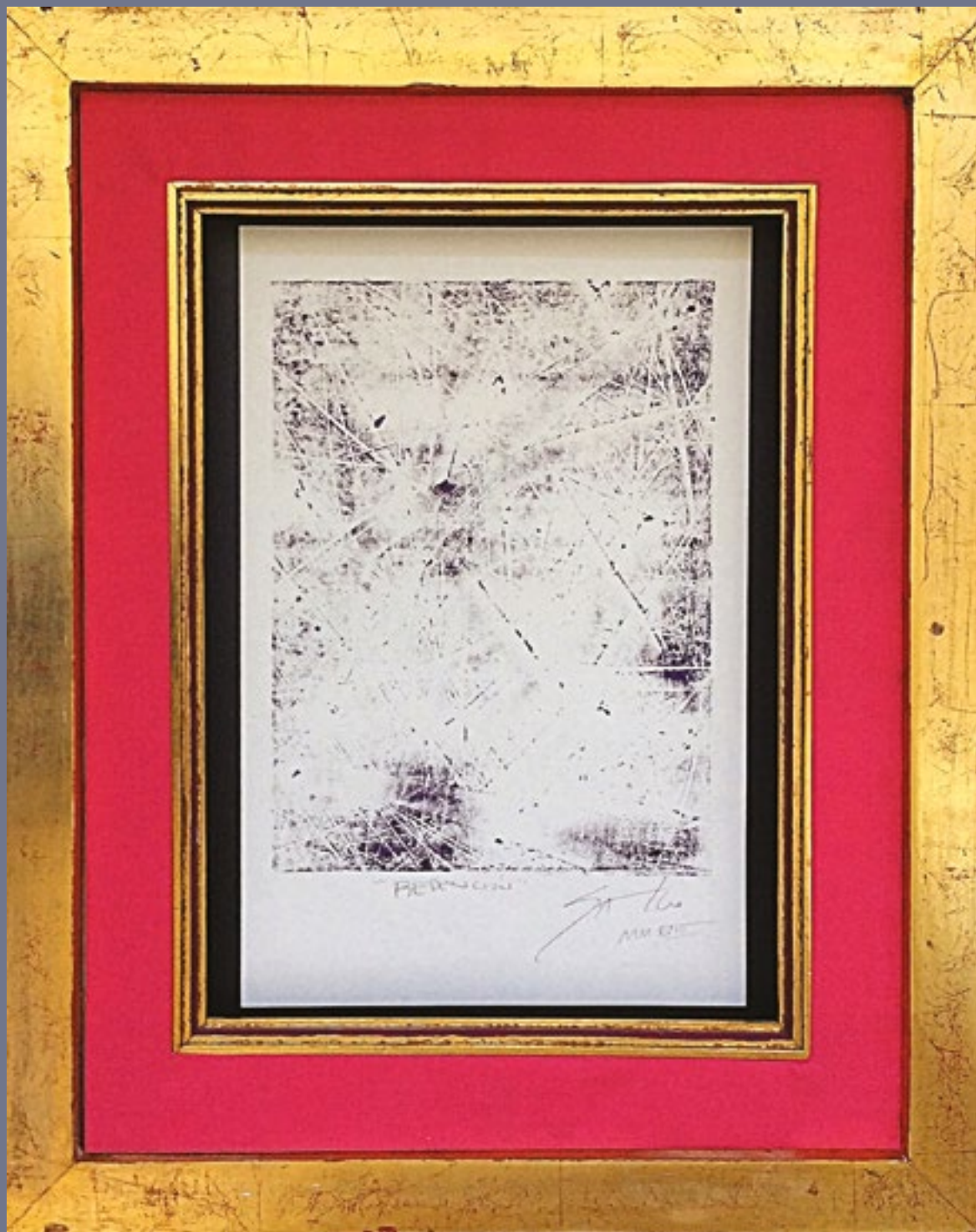
Diagrama. Precedido de evidencia transconceptual