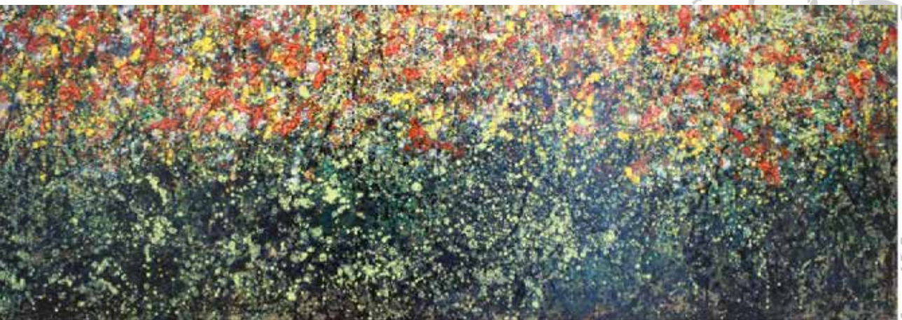
EN PLENA PRIMAVERA