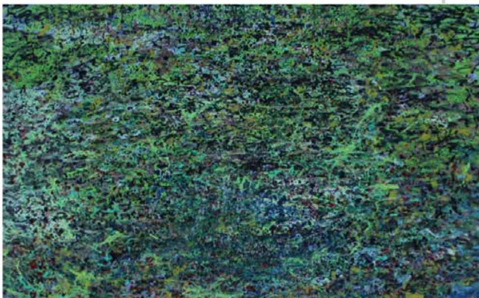
COLORES Y MÁS COLORES