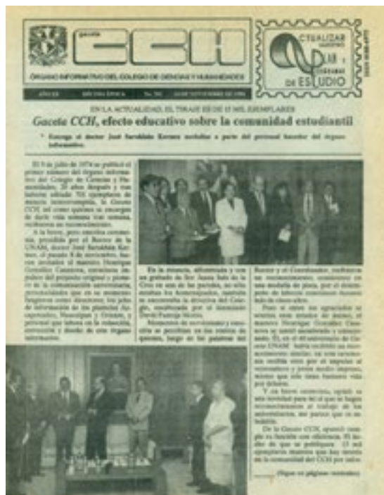
“NUEVOS TÍTULOS DEL PROGRAMA EDITORIAL DEL COLEGIO DE CIENCIAS Y HUMANIDADES” 17

Es tradicional en el Colegio de Ciencias y Humanidades reforzar el proceso de enseñanza-aprendizaje con material didáctico elaborado por profesores del Bachillerato y de la UACPY.