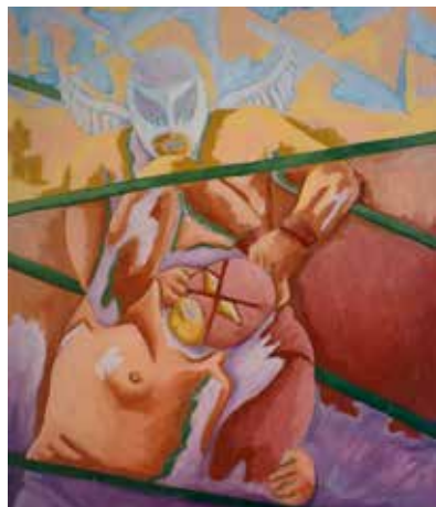
Los rudos, también se van al cielo.

tonces hablar del racismo vinculándolo con el tema de la violencia y también con la desigualdad; con los principales problemas económicos, sociales y políticos del país, por eso decidí escribir este libro.