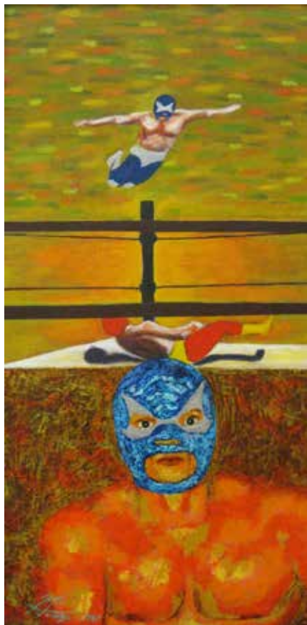
El geniecillo azul.

ese sentido podemos ver la importancia que tiene la historia de México para los mexicanos.