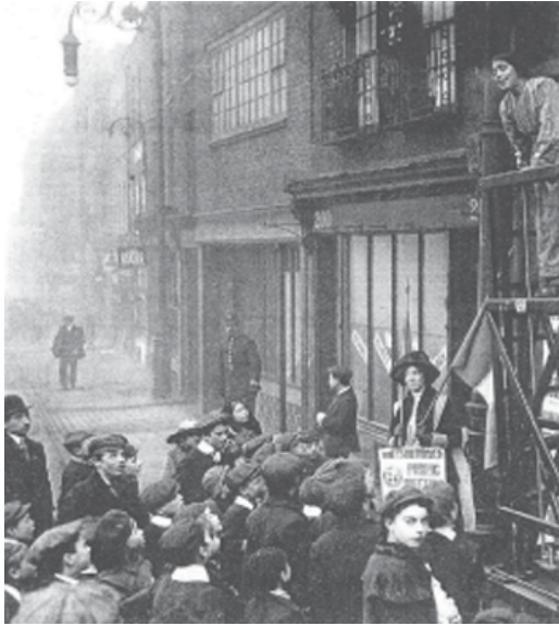
Hulton Getty/Fotogram Stone Images, Las sufragistas , 1912, fotografía. Imagen tomada de Marie- Monique Robin, 100 fotos 100 historias: Las fotos del siglo , Italia, Evergreen, 1999, p. 005.

munidad. En la mayoría de los casos la imagen –como documento visual– amplía los discursos y permite que los hechos perduren; hacen más inolvidables los momentos históricos que han transformado a la sociedad. En palabras de Sylvia Pankhurst, “no se puede cambiar el mundo tanto como quisiéramos, pero sí poco a poco, con pequeños toques” (Robin, 1999, pág. 6).