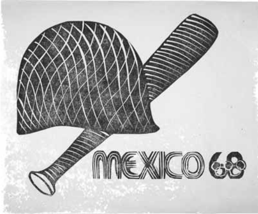
IIISUE/AHUNAM/Colección Esther Montero/Exp. 3/ EM-TX-C1-E13-0720

munistas; corrieron hacia el coche y se alejaron del lugar despavoridos. Lo interesante del acontecimiento, es que éste ocurrió nueve días antes de los lamentables sucesos en el pueblo de San Miguel Canoa, Pue.; la Brigada también estuvo expuesta a ser linchada. De regreso se dirigieron a Querétaro. La siguiente parada fue en San Juan del Río, aproximadamente a las siete de la noche; en la Plaza de Armas repartieron el manifiesto que cayó en manos de un policía del pueblo quien se lo llevó a su jefe, y arrestaron a uno de los brigadistas; los demás compañeros llegaron a la delegación de policía diciendo que iban de parte del arzobispado de México y que no había habido ofensa alguna a la Catedral; así fue como lo soltaron.