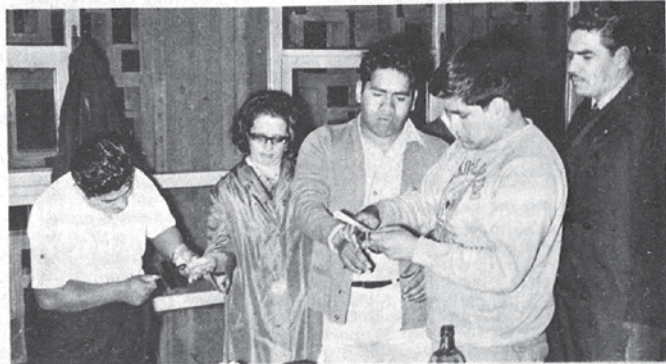
UNA MUJER y un estudiante, de los muchos detenidos durante los disturbios de ayer, son "fichados" en el laboratorio de la Procuraduría del Distrito, al ingresar a los separos. La escena se repitió toda la noche.