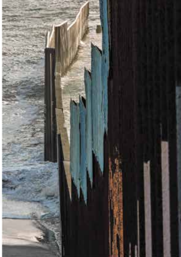
EL MURO Jorge Ríos 2017