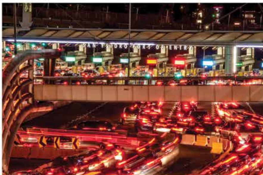
GARITA FRONTERIZA TIJUANA-SAN YSIDRO Héctor Oliva 2017

A un lado de la Catedral se encuentra lo que fue El Fuerte, lugar frecuentado por los turistas de la época para hacerse una fotografía en su fachada; y a un costado se encuentra lo que funcionó como la primera escuela de educación primaria de la ciudad.