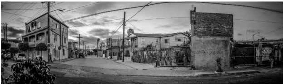
RELOJ CALLE 2da Héctor Oliva 2017

El Callejón Zeta, ubicado en la Calle Primera de la Zona Centro, una vez funcionó como el primer cruce aduanal con Estados Unidos. El Hotel St. Francis fue desplazado de un lugar a otro utilizando grúas de última tecnología en su época.