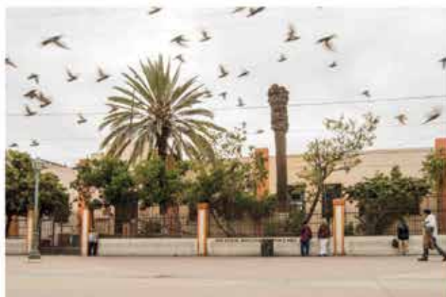
EL FUERTE Mónica Arellano 2017