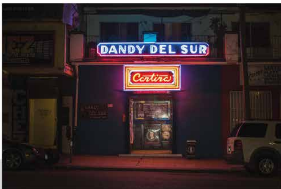
EL DANDY DEL SUR Concepción Armenta 2017