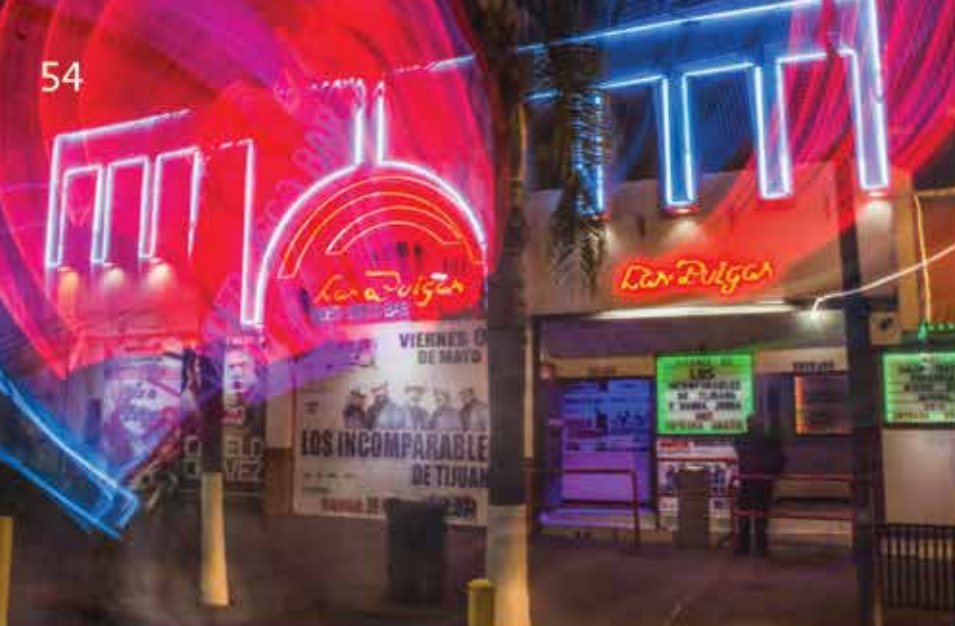
LAS PULGAS Valeria Guzmán 2017