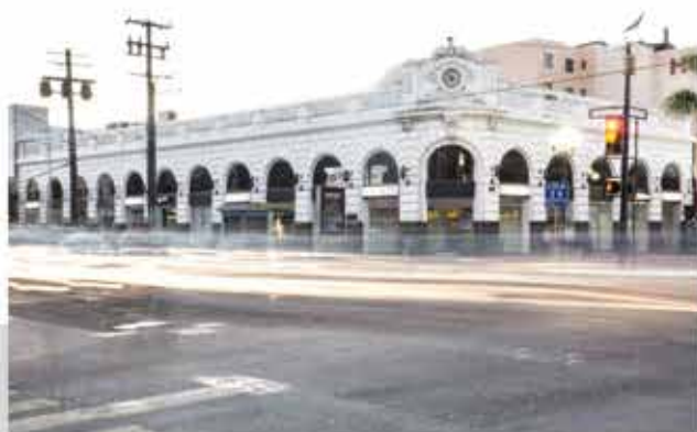
THE BIG CURIO STORE Hilda Santoyo 2017