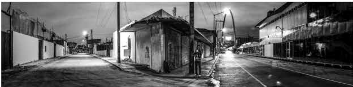
CALLEJÓN ZETA Azucena García 2017