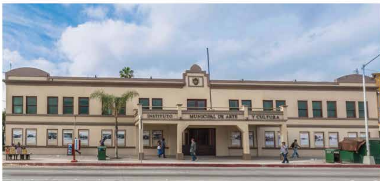
ANTIGUO PALACIO MUNICIPAL