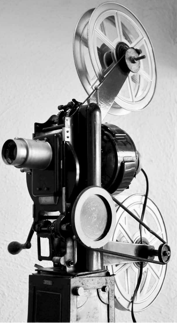
Fotografía: cinematógrafo, Archivo Histórico Fotográfico del Colegio de Ciencias y Humanidades, S.C.I., 2015.

visión reduccionista de ambos lenguajes. Tendríamos que asimilar que la discusión entre qué forma narrativa es “mejor” no es muy fructífera en el aspecto pedagógico ni interdisciplinar, pues creamos prejuicios en los jóvenes que teóricamente ya no son sostenibles.