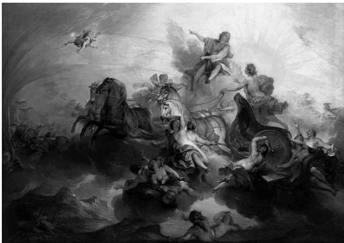
Pintura: Faetón conduciendo la carroza del Sol de Nicolas Bertin (1720).

El siguiente acto lo representa el Faetón conduciendo la carroza del Sol de Nicolas Bertin (1720). En el centro está Helios (de nuevo con los atributos de Apolo) señalando a su hijo Faetón el camino por donde tiene que ponerse en marcha: “la húmeda noche ha alcanza-