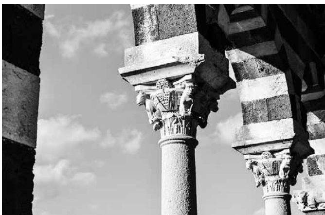
Old Cathedral in the countryside by osmar01, Feb 3, 2014 www.freeimages.com

La lectura directa de los episodios en la obra de Ovidio se enriquece enormemente con las numerosas imágenes que representan las distintas fases de la historia, al grado de que puede hacerse un relato continuo de cada narración que consista únicamente en imágenes. Un aspecto relevante inicial es que cada artista ha elegido para plasmarlo en su obra el momento de la historia que más se adecuaba a sus pretensiones artísticas.