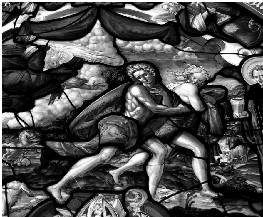
Stained glass portraits

Podría resultar igual de fructífero e interesante revisar la obra de un autor consagrado a los temas mitológicos de origen ovidiano, como el pintor italiano Titian, con respecto al cual “ningún otro artista de envergadura dedicado a la narrativa mitológica depende tanto de Ovidio”. 13 O ver la reelaboración de un mismo episodio por parte de un mismo artista, como hace Nicolas Poussin en sus dos versiones de la historia de Narciso y Eco. O revisar una misma escena en interpretaciones de distintos artistas y con distinta forma de expresión, y