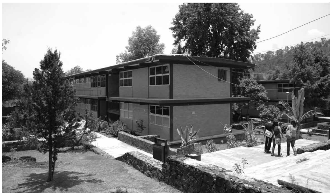
Fotografía: Edificio W, CCH Sur, Histórico Fotográfico del Colegio de Ciencias y Humanidades, S.C.I., 2013.